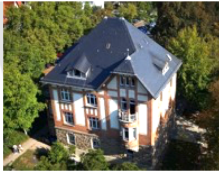
Tübingen School of Education (TüSE)