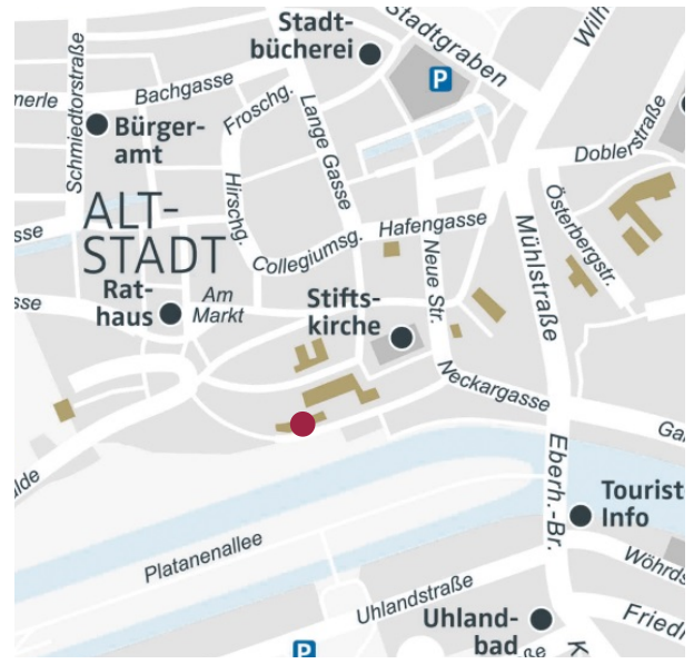
Kunsthistorisches Institut, Alte Burse, Bursagasse 1, 72070 Tübingen, linker Treppenaufgang, Raum X