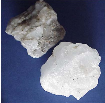
Abbildung 1: Steinsalz aus dem Bergwerk Stetten bei Haigerloch.

Natriumchlorid findet sich in großen Lagerstätten als Steinsalz ( Abbildung 1 ) oder in Salzseen. Viele Stadtnamen rühren vom Salzbergbau her, z.B. Bad Reichenhall und Hallstadt.