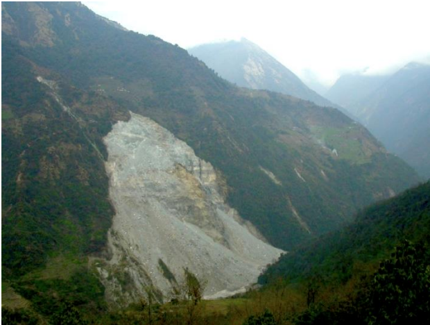
Frischer Erdrutsch nahe Chomrong im Himalaja in Zentral-Nepal.