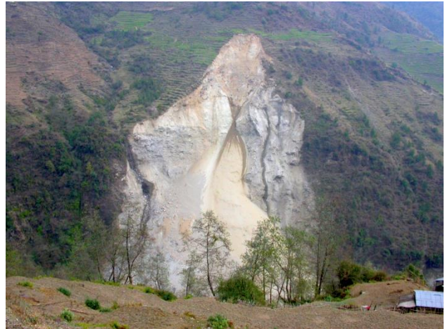
Frischer Erdrutsch nahe Kimrong im Himalaja in Zentral-Nepal.