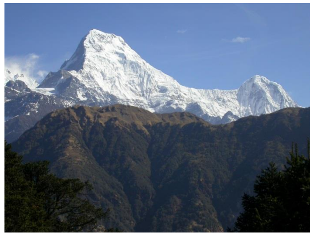
Die Berge Annapurna Süd (links) und Hiunchuli von Ghandruk im Himalaja in Zentral-Nepal aus gesehen. Foto (Aufnahme im März 2005): David M. Whipp