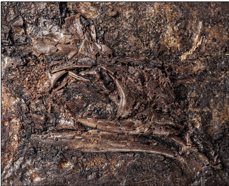
Fossiler Schädel von Geiseleptes delfinoi aus dem Eozän, der im früheren Braunkohleabbaugebiet Geiseltal in Sachsen-Anhalt gefunden wurde. Oben in Fundlage, unten die Umriss im computertomografischen Bild. Abbildungen: Oliver Wings, Andrea Villa.

Wie Geiseleptes delfinoi gelebt hat, ist ungewiss. Aufgrund der Ähnlichkeiten zum heutigen europäischen Gecko gehen die Forscher davon aus, dass er wie dieser dämmerungs- und nachtaktiv war. „Wahrscheinlich gehörte das Geiseltal im Eozän nicht zum bevorzugten Habitat von Geiseleptes . Sonst wären mehr Fossilien von dieser Art zu finden gewesen“, spekuliert Villa.