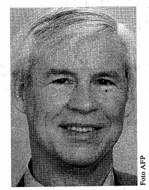
Robert F. Engle

gut einer Million Euro, zu gleichen Teilen. Mit dieser Entscheidung wendet sich die Königlich Schwedische Akademie neuerlich den stark mathematisch geprägten Methoden zu, die in der Ökonomie an Bedeu-