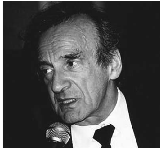
Elie Wiesel, Boston 1998

Die Pädagogik Elie Wiesels: uns menschlicher machen