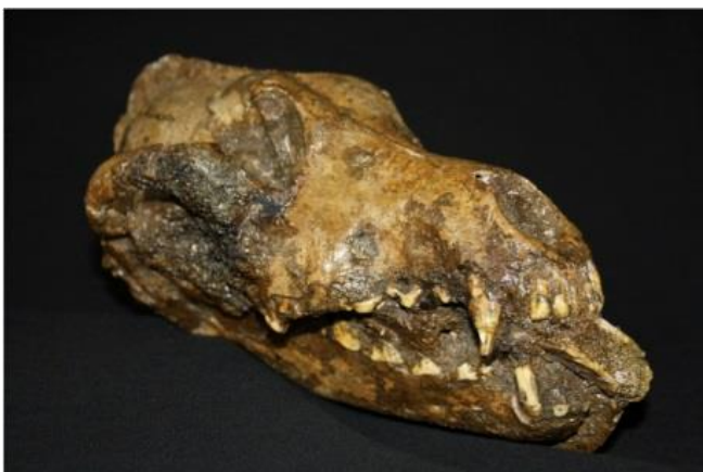
Schädel eines steinzeitlichen Hundes von der Fundstelle Předmostí I.

Vereinfachte Darstellung der Jäger-Beute-Beziehungen zwischen prähistorischen Menschen und Großsäugern in Předmostí I vor 30.000 Jahren – rekonstruiert aus den Isotopenanalysen der Knochen. Illustration: Hervé Bocherens. Urheber der Einzelelemente: Wollhaarmammut, Wollnashorn, Pferd & Höhlenlöwe: Mauricio Antón/DOI:10.1371/journal.pbio.0060099; Moschusochse: U.S. Fish and Wildlife Service; Rentier: Alexandre Buisse; Wolf: Santiago Atienza; Vielfraß: Matthias Kabel; Braunbär: Jean-Noël Lafargue; Hunde: Margo Peron; Bison: Michael Gäbler; Prähistorischer Mann: Hervé Bocherens.