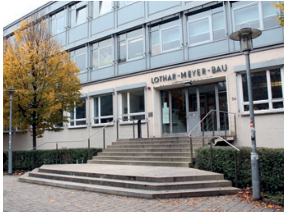
→ TÜBINGER STANDORT DER ARBEITSGRUPPE → HEADQUARTERS OF THE WORK GROUP IN TÜBINGEN

→ which climate studies has played for several decades now, attracting researchers and motivating them to ask new questions." EarthShape intends to approach this new chapter in the history of the geosciences using Chile as an example by looking at, among other things, how vegetation influences the formation of soil from bedrock, the hydrologic cycle, and erosion and sedimentation processes.