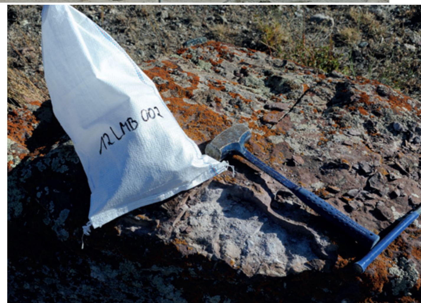
→ INSTALLATION EINER WETTERSTATION AUF DEM ALTIPLANO IN BOLIVIEN IN 3500 METERN HÖHE → INSTALLATION OF A WEATHER STATION ON THE ALTIPLANO IN BOLIVIA AT AN ALTITUDE OF 3,500 METRES