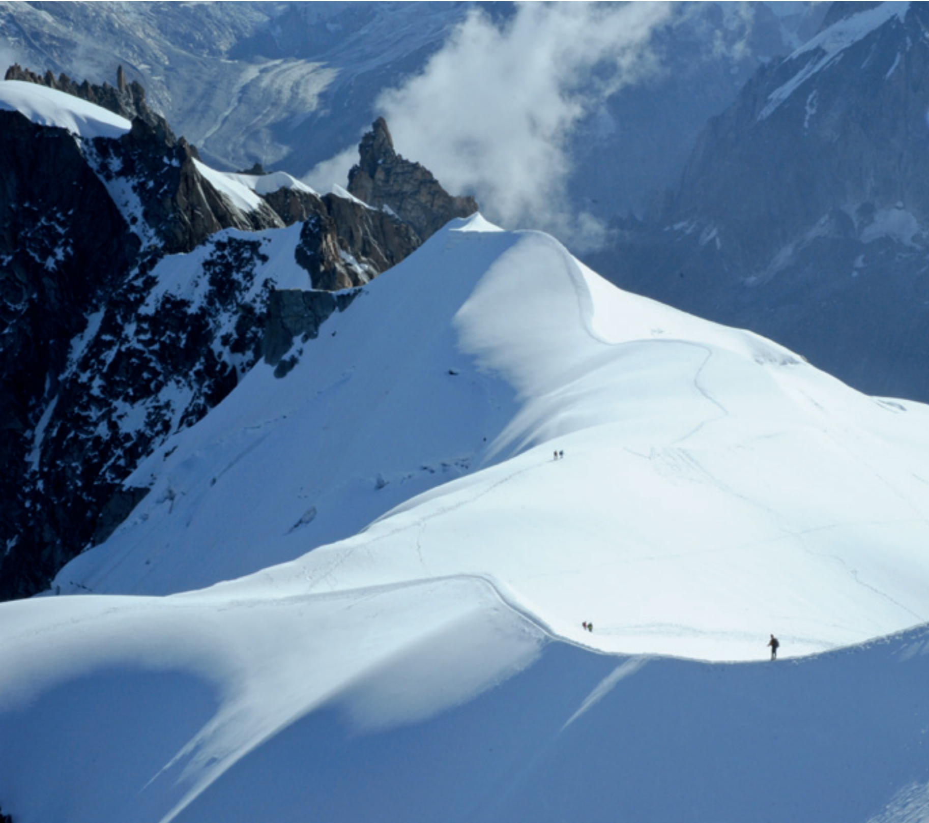
→ DIE GEOWISSENSCHAFTLER SIND IN EISIGEN HÖHEN UNTERWEGS: WANDERUNG AUF DEM MONT-BLANC-MASSIV → GEOSCIENTISTS VENTURE OUT ON ICY HEIGHTS – A HIKE ON THE MONT BLANC MASSIF