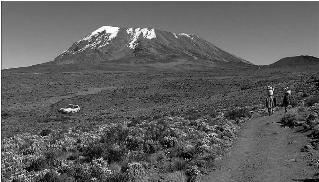
Der Expeditionsmagnetschwebewagen Fuchspfote vor dem Kilimandscharo.

(Alle nehmen Gepäck auf und wandern los. Nach einer Weile bleiben sie schnaufend stehen)