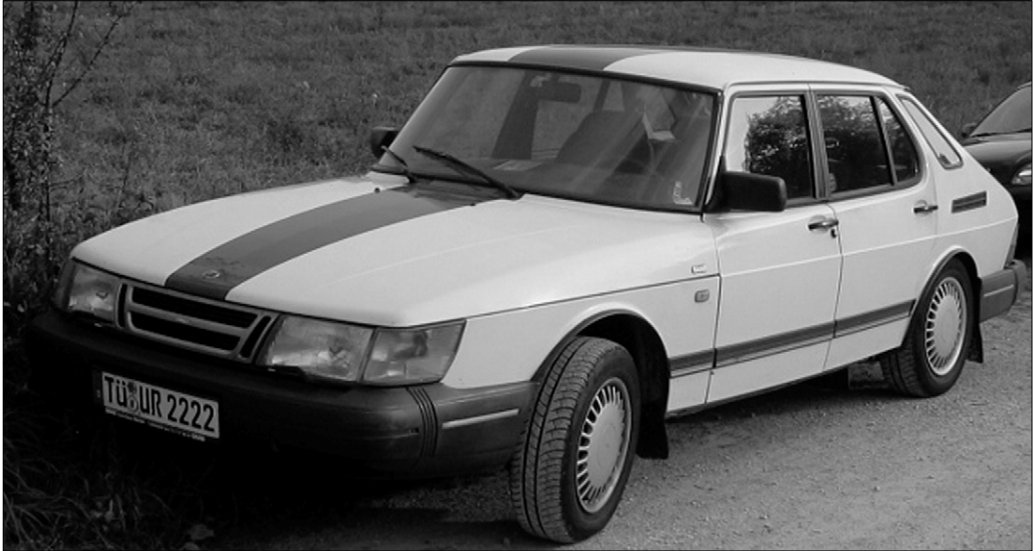
Der Expeditionsmagnetschwebewagen Fuchspfote.