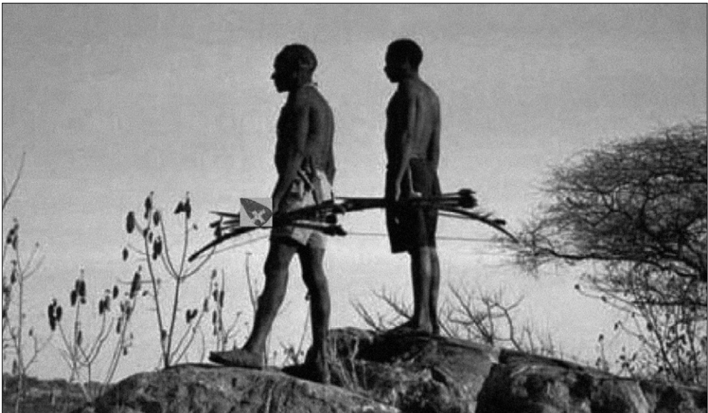
Hadzabe-Jäger mit dem ‚Schweizermesser‘-Faustkeil.

(Alle sind wieder aufgestanden und stehen mit der Teetasse in der Hand da)