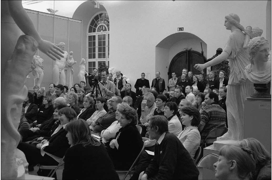
Das gespannte Publikum während der Uraufführung am 24.11.2007 im Rittersaal auf Schloss Hohentübingen.