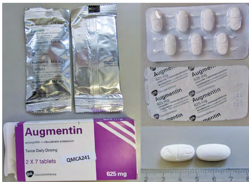
Abb. 2 Gefälschtes „Augmentin®“ (Amoxicillin/Clavulansäure) aus Kamerun, 2017. Die Tabletten enthalten keinen Wirkstoff [4].