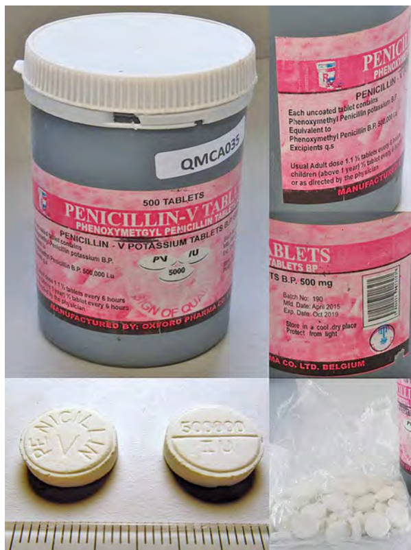
Abb. 1 Gefälschtes „Penicillin V“ aus Kamerun, 2017. Die Tabletten enthalten kein Penicillin V, sondern 50 mg Paracetamol [3].

in ärmeren oder weniger streng regulierten Ländern in vielen Gesundheitseinrichtungen, vor allem bei privaten und insbesondere nicht lizenzierten (= illegalen) Anbietern, gefunden werden [9].