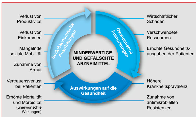
Abb. 4 Auswirkungen von minderwertigen und gefälschten Arzneimitteln (modifiziert nach [10]).

Der genannte Übersichtsartikel von Nayyar et al. [13] wertete insgesamt 28 Studien aus, die im Zeitraum von 2001 bis 2010 in Afrika und Asien durchgeführt wurden. 21 dieser Studien mit insgesamt 2.634 Arzneimittelproben lieferten Qualitätsdaten zu Malaria-mitteln in afrikanischen Ländern. Für 796 (35 %) dieser Proben wird berichtet, dass sie nicht den Qualitätsanforderungen entsprachen. Für 121 Proben wird ein zu geringer