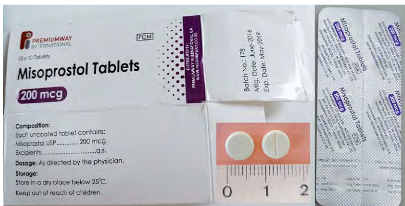
Abb. 3 Misoprostol-Tabletten minderwertiger Qualität aus Malawi, 2017. Die Tabletten enthalten nur 13 % der deklarierten Wirkstoffmenge.

Ein Übersichtsartikel von Nayyar et al. [13] im angesehenen Fachjournal Lancet Infectious Diseases berichtete 2012, dass im Subsahara-Afrika 35 % der Malaria-mittel bei der chemischen Analyse nicht den Qualitätsstandards entsprachen und 20 % als gefälscht klassifiziert wurden. Dem widersprach die Arbeitsgruppe um Harpakash Kaur von der ebenso angesehenen London School of Hygiene and Tropical Medicine. Unter dem Titel Fake anti-malarials: start with the facts [14] berichtete sie, dass bei der Untersuchung von 10.000 Arzneimittelproben vor allem aus afrikanischen Ländern nur 1 % der Malaria-mittel als gefälscht und weitere 7,7 % als minderwertig identifiziert wurden. In der Hälfte der untersuchten afrikanischen Länder wurden überhaupt keine gefälschten Malaria-mittel gefunden. Wie erklären sich solch dramatische Unterschiede der Studienergebnisse zur Häufigkeit gefälschter und minderwertiger Arzneimittel?