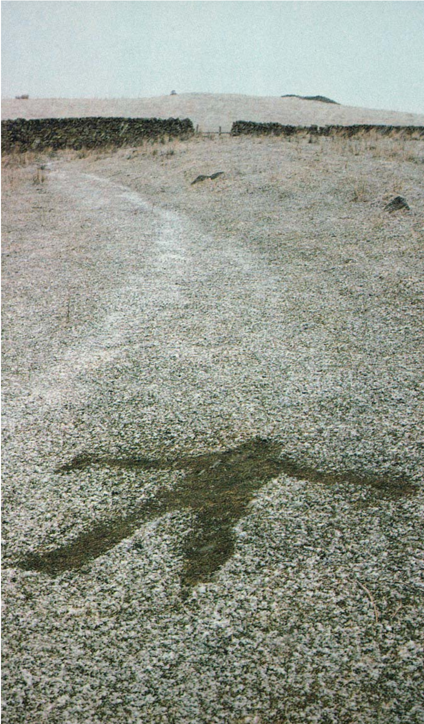
Hingelegt wenn es anfang zu schneien und gewartet bis der Boden von Schnee bedeckt war. Twet Tarn, England. 5. März 1988. (Copyright Andy Goldsworthy, Abdruck aus Andy Goldsworthy , (1991), mit freundlicher Genehmigung von Zweitausendeins, Frankfurt am Main

werfen und dieses mit der Angabe von ein paar meist ähnlichen Definitionen anderer Wissenschaftler garnieren.