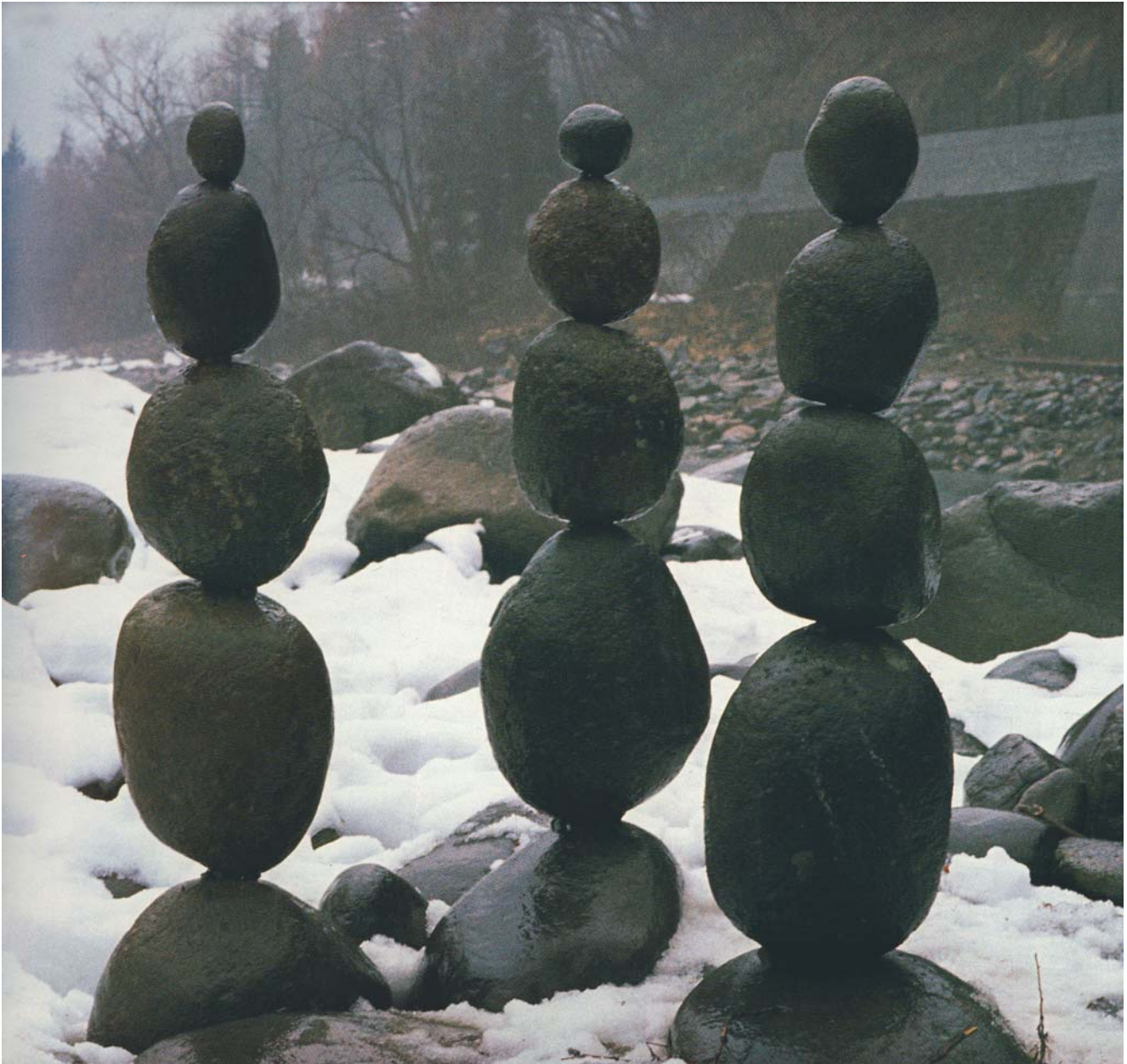
Ausbalancierte Steine. 24. September 1982. Copyright Andy Goldsworthy, Abdruck aus Andy Goldsworthy , (1991), mit freundlicher Genehmigung von Zweitausendeins, Frankfurt am Main

Bedeutungsstränge, die ihren Ursprung im sächsischen Freiberg beziehungsweise Rio de Janeiro haben, beide mit dem Wort "nachhaltig" zu bezeichnen. Die Uneinheitlichkeit und Zögerlichkeit bei der Übersetzung von "sustainability" mit "Nachhaltigkeit" im deutschen Sprachraum wird dadurch teilweise erklärt.