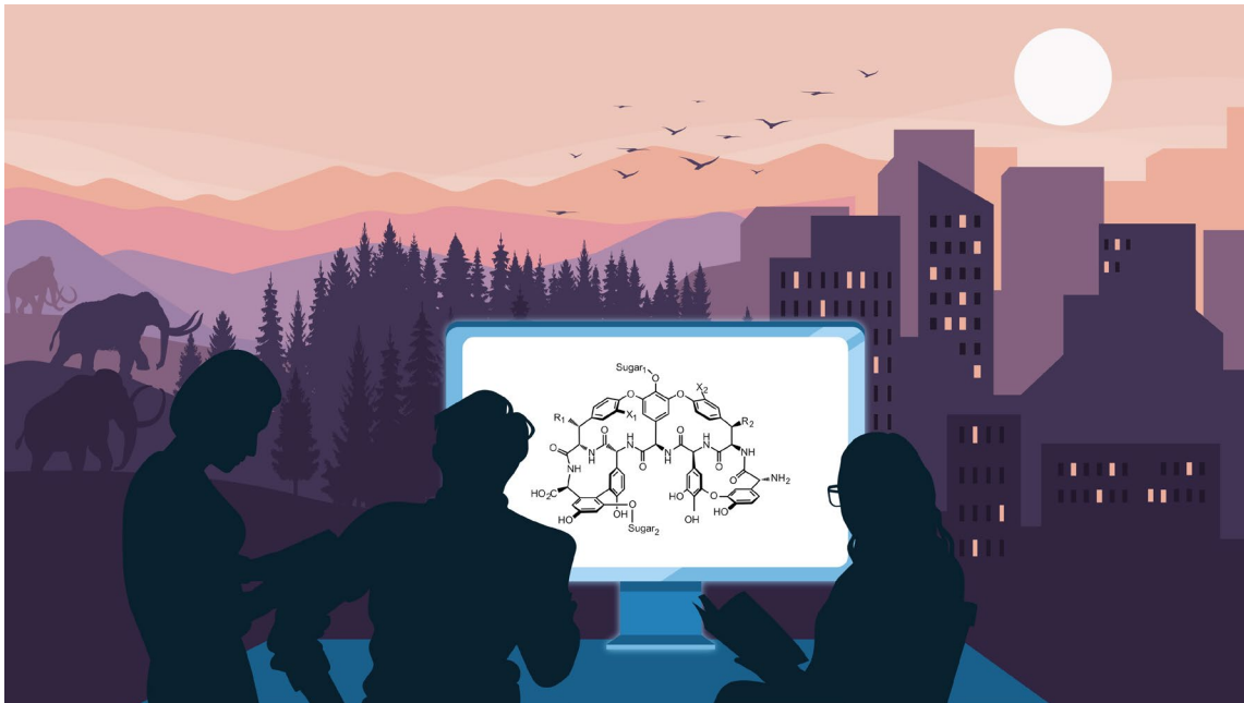
Forscherinnen und Forscher der Universität Tübingen drehen die Evolution einer antibiotischen Stoffklasse mithilfe von Computertechnik zurück. Die Erkenntnisse können für die Entwicklung neuer Medikamente genutzt werden. Illustration: Anna Voigtländer.