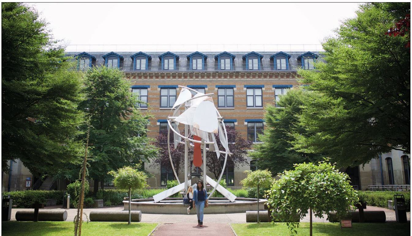
An der iaelyon School of Management können nun auch die Tübinger Studierenden ihr Masterstudium absolvieren.

Weitere Infos unter: http://www.uni-tuebingen.de/de/115976