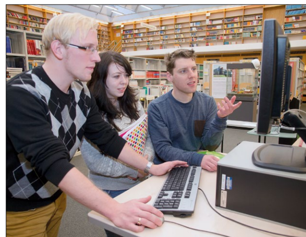
Es lohnt sich, detaillierte Informationen über mögliche Studiengänge, Module und Spezifikationen zu eruieren

Die Vorlesung Comparative Politics behandelt Theorien und Methoden der vergleichenden Analyse politischer Systeme und deren Anwendung auf spezifische politische Systeme und Probleme des Regierens. Sie lernen die Besonderheiten der politischen Regierungsformen und der