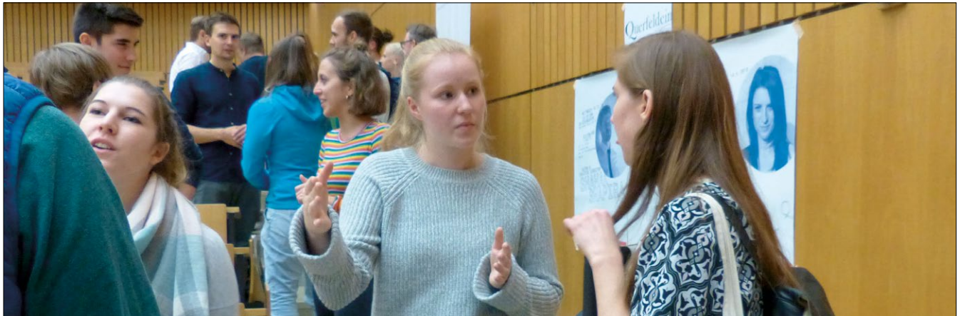
Studierende tauschen sich aus über gesellschaftliches Engagement und Praxiserfahrung