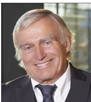
Honorar- professor Dr. Helmut Hauss- mann

Der Bundeswirtschaftsminister a.D., Diplomkaufmann, Dienstleistungsunternehmer und Honorarprofessor an der Universität Erlangen-Nürnberg bringt praktische Erfahrungen als selbstständiger Unternehmer in die Lehre am Fachbereich Wirtschaftswissenschaft.