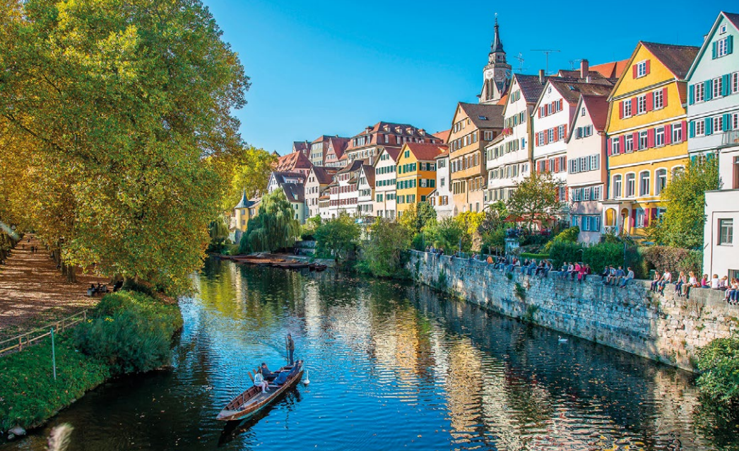
Nicht nur Wiwis zieht es nach Tübingen zurück.

Bei herrlichem Wetter trafen etwa 40 Alumni aus den verschiedenen Städten und auch Lebensabschnitten am einem langen Tisch zusammen. Manche waren seit vielen Jahren nicht mehr an der Alma Mater gewesen und ihr Abschluss lag mehr als 20 Jahre zurück. Die jüngsten Absolventen des Netzwerks, kamen durchnächtigt nach der Zeugnisverleihung und anschließender Graduate Party für eine Stärkung vorbei. Von alleingewesenen Tübingern, die in der Stadt geblieben waren, bis hin zu einer Alumna aus Taiwan, waren Persönlichkeiten vertreten.