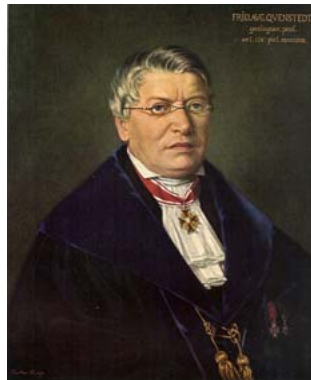
Friedrich August Quenstedt 1809—1889