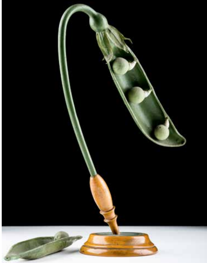
→ ERBSENHÜLSE (PISUM SATIVUM) → PEA POD (PISUM SATIVUM)