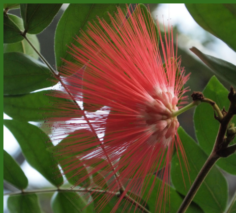
Ein Blick auf die Unterseite zeigt, dass es sich um viele Einzelblüten handelt.