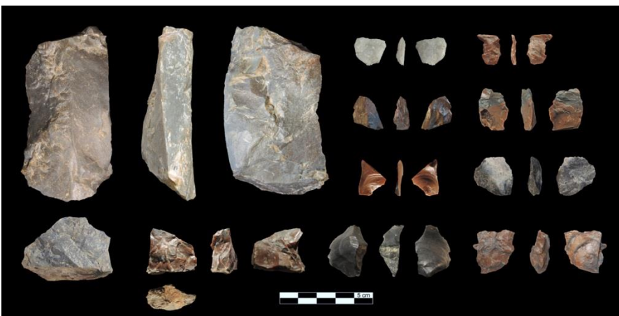
Abb. 2: Auf der Ausgrabung gefundene Steingeräte.