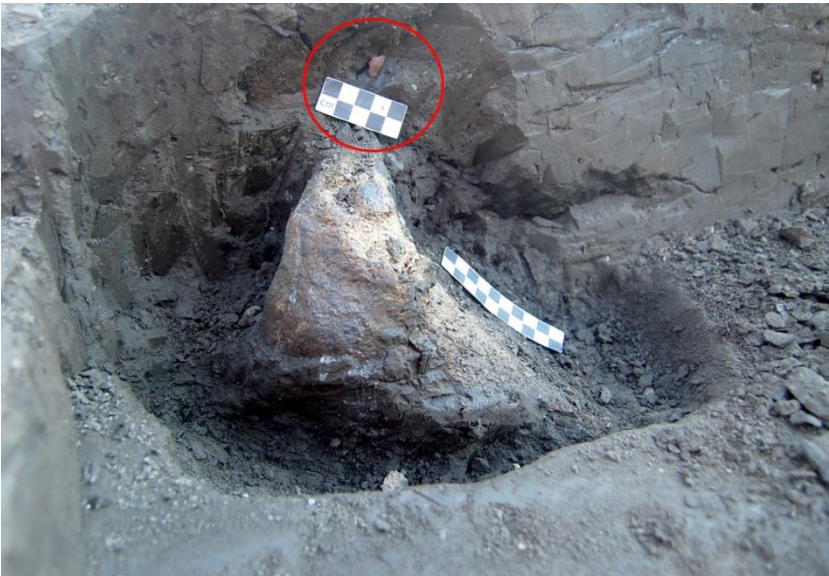
Abb. 3: Oberes Ende der Tibia des Elefanten und ein in der Nähe gefundenes Steingerät.