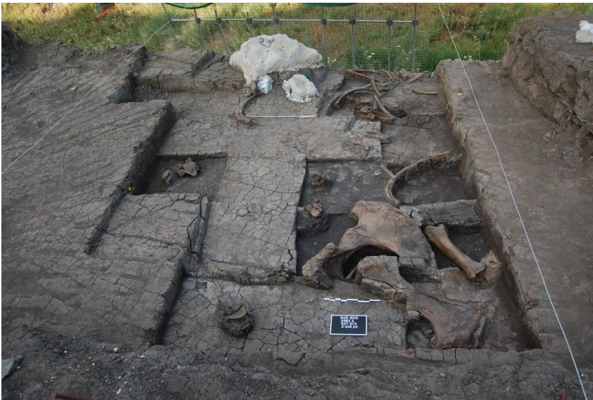
Abb. 1: Ansicht der Ausgrabungsfläche mit einem Teil der freigelegten Elefantknochen. Im Hintergrund ist der mit einer Gipspackung gesicherte Schädel zu erkennen.