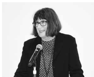
オープニングセレモニーで挨拶する チュービンゲン大学アモス副学長。