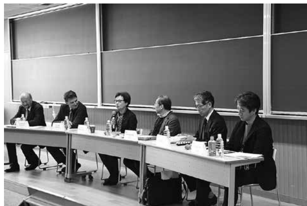
〔Panel 3〕 今出川・良心館 305 教室

Panel 3 concentrated on “Freedom of Speech/Thought and Consideration for Others”, which is per se a legal topic, but with a wide range of social, political and cultural implications. This became very clear during the five presentations, which highlighted above others the problem of political speech in the internet, where the limits of legal restriction were explained by citing relevant jurisdiction, as well as the importance of awareness of cultural differences in educational programs. The presentation of results of related sociological and political field work gave an additional and very enlightening incentive to understand the complexity of the subject, which was rounded up by a report on a citizens initiative in Kyoto, dealing with racist activities against Korean schools in Japan.（ハンス ペータ・マルチュケ座長）