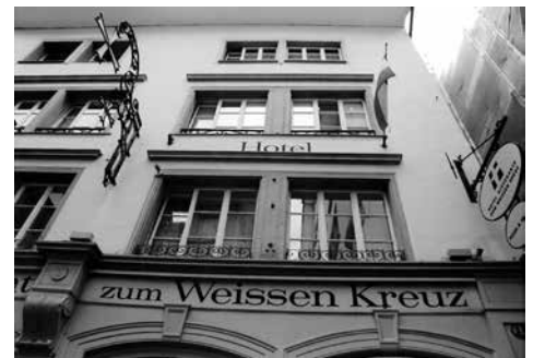
1884年8月8日にルツェルン（Luzern）で、新島が宿泊した Hotel the Weissen Kreuz は、現存する。この2週間後にヘルマン・ヘッセと出会うことになる。