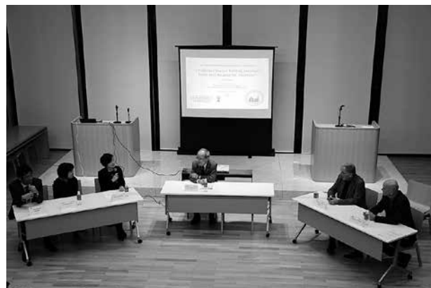
〔Panel 1-1〕 京田辺・言館礼拝堂

オープニングセレモニーに続き、「身体的・精神的多様性と“人間の尊厳”」をテーマに、自然科学分野における最先端の研究と視点から、ヒトを含む生物が持つ多様性について議論しました。話題は、ヒト角膜の再生医療、遺伝子変異による多様性と進化、コウモリの反響定位システムと工学的応用、児童思春期のメンタルヘルスの問題など多岐にわたり、医学、生物学、工学、心理学などの実験科学が多様性をどのようにとらえ、現代社会における問題解決にどのように貢献できるかについて、会場からの活発な質問もあり、理解を深めることができました。（櫻井芳雄座長）