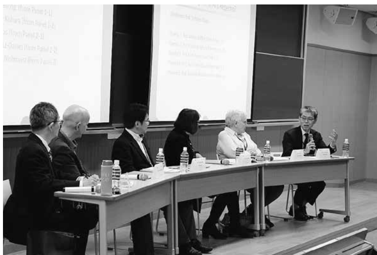
〔ラウンドテーブル〕 今出川・良心館 305

最後のラウンドテーブルでは、全ての人の「人間の尊厳」が尊重される社会実現のために大学はどのような貢献ができるかがテーマでした。人間の尊厳を守るために社会から差別と偏見を根絶しなければならないことは言うまでもないことですが、そのために大学として、教育プログラム、研究レベル、学生の自主的な活動など、様々なレベルでの貢献が可能であることが確認されました。一方で、大学は真理を知るための基本的作法を教えることに集中すべきだという意見も出ました。つまり自らの頭で考える批判的思考力を身に付けさせることが解決の近道でもあるという考えです。議論の結果、批判的精神を身に付ける「知育」と共感力や倫理観を育む「徳育」の両方が重要であることが認識されました。自ずと同志社の建学の精神の柱の一つである「知（智）徳併行」の実質化の必要性が両大学で共有されたことになりました。（和田喜彦モデレーター）