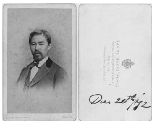
新島襄がドイツで撮影したポートレート写真 (1872年ベルリン市内の写真館にて)