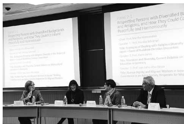
〔Panel 2-1〕 今出川・良心館 305 教室

「多様な人種・宗教背景を持つ人々の尊重と共存」をテーマとした当パネルは、日本の歴史における宗教間の交流、ドイツにおける多文化教育、そして日本における外国人労働者政策といったアプローチから社会における多様性と共存を考える貴重な機会となりました。それぞれの専門領域は異なるものの、「二元論的」な狭い考え方は閉鎖性や不寛容、そして対立といった結果につながるということが共通して確認されました。また、多様性の中にも共通性を見つけることが受容につながり、共存するには人間の尊厳を守ることから始まる、といった認識が共有されました。このような多様性への理解を育てるための教育のあり方について貴重な示唆と刺激とを与えられました。(マーサ・メンセンディーク座長)