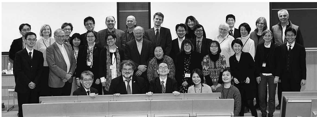
全てのセッション終了後、良心館にて。

様々な困難もありましたが、シンポジウムそのものでは、議論が活発に交わされ、大きな成果をあげることができたのも、関係各位の献身的な御尽力の賜物であります。この場をお借りして謝意を申し上げます。