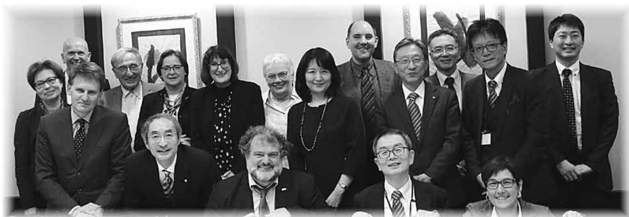
チュービンゲン大学訪問団と松岡学長、植木副学長、横川副学長らとの懇談。