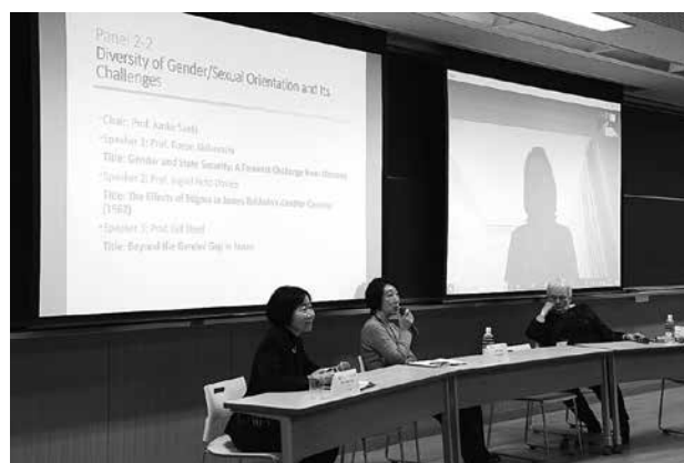
〔Panel 2-2〕 今出川・良心館 305 教室

パネル2-2では、沖縄の女性運動や性暴力の社会的実態、アフリカ系アメリカ人作家・ジェームス・ボードウィン『アナザー・カントリー』に関する社会科学的分析、日本のジェンダーギャップの大きさと女性の幸福感の矛盾という、方法論やフィールドが多岐にわたる発表が一同に会しました。一見かけ離れたテーマでありながら、ジェンダーや居住地、出身地によって抑圧される社会的弱者共通の「スティグマ」「トラウマ」の経験が明らかになり、本来的に学際的、国際的課題であるジェンダー、セクシュアリティの問題について、日独英からの参加により、活発な議論が交わされました。「ジェンダーの主流化」（95年北京女性会議）にも即し、地域が抱える固有の文化的歴史的背景の相違も考慮しつつ、将来の課題解決をも見据えた充実したパネルとなりました。（佐伯順子座長）