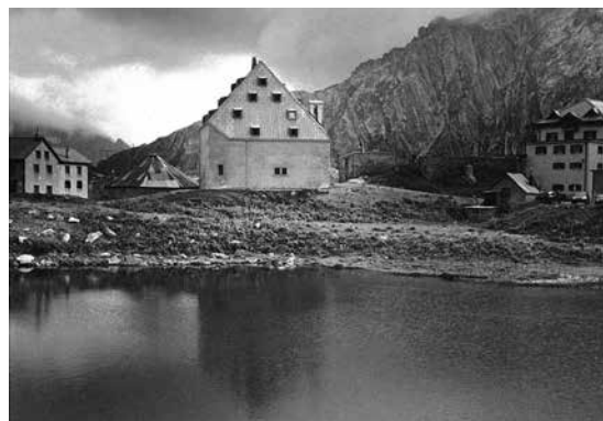
サン・ゴタール峠の、新島襄が遺書を書いたと思われるホテル。