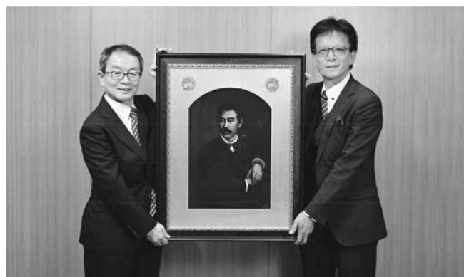
EU キャンパスに掲げられる予定の新島襄の肖像画と筆者。

*本稿では、ドイツ語名称 (Philosophische Fakultät) を、「人文科学部」と訳し使用しております。