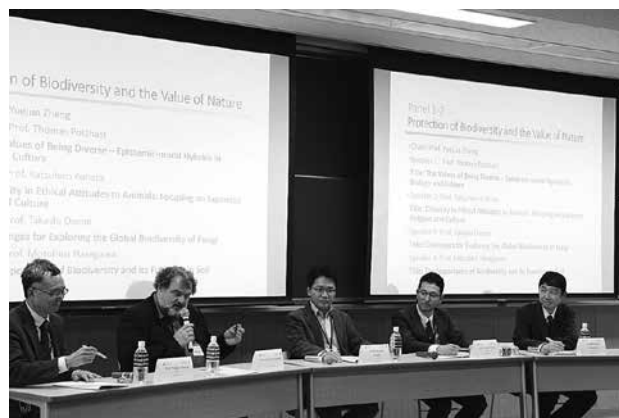
〔Panel 1-2〕 今出川・良心館 305 教室

パネル1-2では、生物多様性と自然の価値をキーワードとして議論が行われました。国内外の4名の登壇者は、それぞれ、倫理的・認識論的視点から見た生物多様性と文化多様性、人間と動物の関係の歴史的展望、真菌類のグローバルな多様性と土壌中の生物多様性をめぐって、ダイバシティの形態と意味づけに関する最新の研究成果を報告されました。後に、フロアの参加者も加わり、熱い学際的議論が交わされました。一連の意見交換を通じて、生物多様性に関する課題はまだまだ多く残されていること、生物多様性の重要性に対する一般の人びとの認識を高めることの重要性、政策立案に寄与しうる研究を実施することの重要性などについての共通認識が得られました。(鄭躍軍座長)