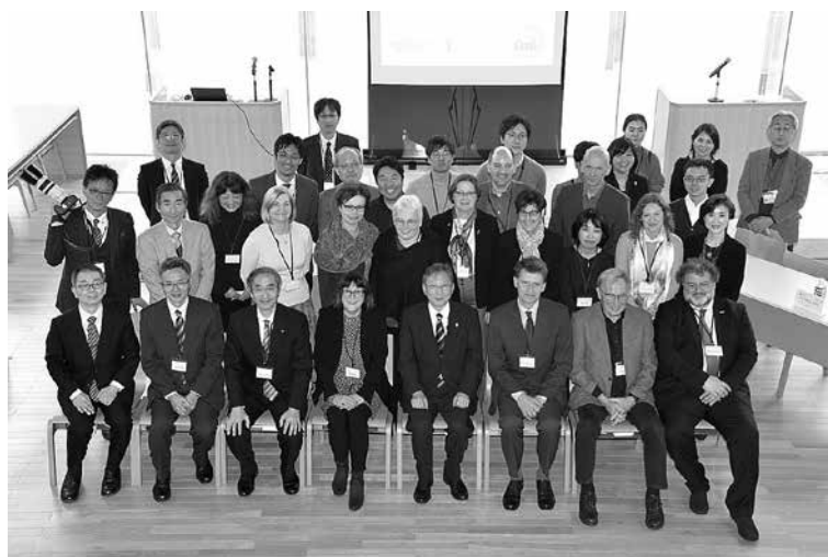
第1日目、京田辺・言館礼拝堂にて。

『『ダイバーシティ』を尊重する社会構築への挑戦』をメインテーマとし、以下のサブテーマ別にパネル・セッションを設けました。身体的・精神的特性の多様性、生物多様性、性の多様性、宗教や民族の多様性、そして、思想や表現の多様性という視点から本学とチュービンゲン大学の研究者や大学院生が英語で激論を交わしました。