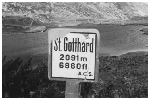
サン・ゴタール峠