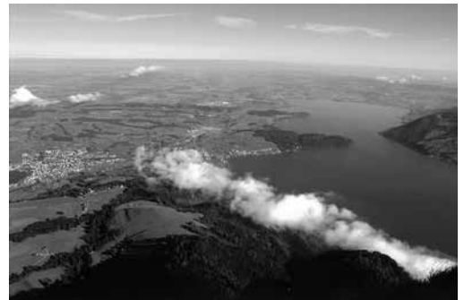
リギ山の登山鉄道と、リギ・クウム（Rigi Kulm）からの眺望。