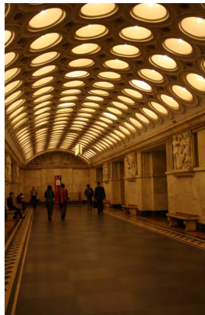
Die Moskauer Metro, die Station Elekozavodskaja

Bindeglied zwischen „alt und neu“, „gestern und heute“, „hier und dort“ waren für uns Stalins „Paläste für das Volk“: die Metro.