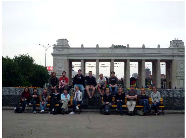
Die Exkursionstruppe im Gorkipark