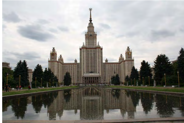
Die Moskauer Lomonosov Universität

Ein besonderer Höhepunkt, weil für Touristen ansonsten nicht zugänglich, war für uns die Besichtigung zweier architektonischer Besonderheiten der Stadt: die Lomonosov Universität und das Wohnhaus Narkomfin . Eine Führung in der Universität, der im sogenannten Zuckerbäckerstil gebauten und an exponierter Stelle gelegenen Universität, offenbarte uns eine gigantische und repräsentativ gestaltete Campusanlage sowie schöne Stadtansichten aus den Fenstern des universitätseigenen geologischen Museums. Ganz anders stellte sich das im konstruktivistischen Stil 1929/30 errichtete Kommunehaus Narkomfin dar, dessen Bausubstanz heute am Zerfallen ist. Das Ziel des Architekten war es, eine soziale Utopie zu verwirklichen und den Menschen eine eigene Wohnung zur Verfügung zu stellen. Diese war in erster Linie als Schlaf- und Wohnstätte gedacht, da das eigentliche Leben sich in öffentlichen Räumen wie Kantine, Waschsalon oder auf der Sonnenterasse abspielen sollte. Bei der Besichtigung von zwei Wohnungen in dem heute weitgehend leerstehenden Haus wurde allerdings deutlich, dass diese Vorstellungen Theorie geblieben waren. Die Bewohner nahmen aus Wunsch nach Privatsphäre Eingriffe in die Aufteilung der Räumlichkeiten vor und bauten Bäder und Küchen ein.