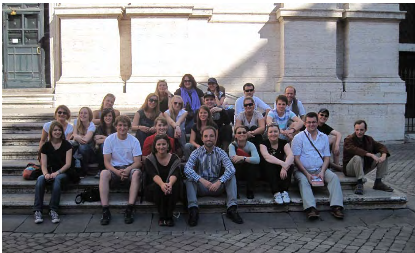
Die Exkursionsgruppe auf den Stufen vor Il Gesù