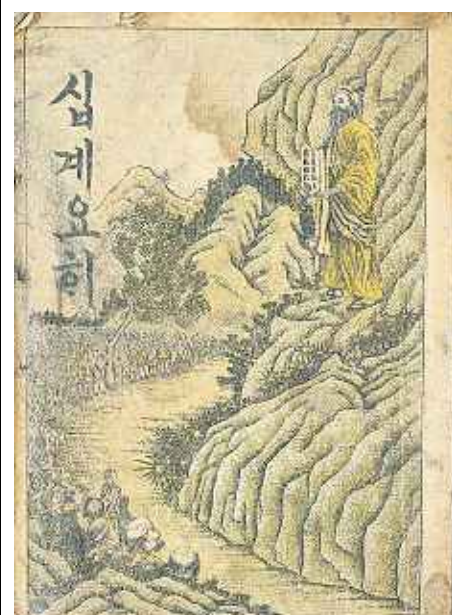
Koreanische Übersetzung der Zehn Gebote (1911), ebenfalls zu sehen in der Ausstellung „Der Luthereffekt“ des Deutschen Historischen Museums im Martin-Gropius-Bau.

Mehr als 60 der rund 120 in die USA entliehenen Werke stammt von den Staatlichen Museen zu Berlin. Für deren Generaldirektor Michael Eissenhauer war es „ein Anliegen und eine große Freude, sie jenseits des Atlantiks zu präsentieren“. Nun kommen sie nach Kreuzberg. Ein Kirchengang lohnt sich. SILKE ZORN