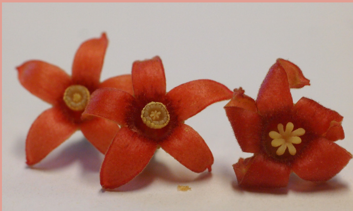
Männliche (links) und weibliche (rechts) Blüten von Cola millenii .

„Kolanüsse“ werden in einigen tropischen Regionen angebaut, jedoch meist nicht auf speziellen Plantagen, sondern in Mischkultur mit Kakao oder als Schattenbäume in Kaffeeplantagen. Wegen ihres Koffeingehaltes gehören sie auch schon immer zur Rezeptur eines bekannten, koffeinhaltigen Erfrischungsgetränkes, in dessen Name sich diese afrikanische Zutat auch wiederfindet.