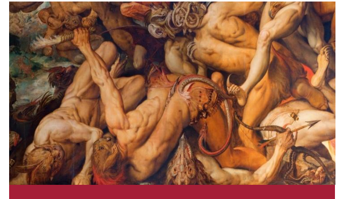
SFB 1391 Andere Ästhetik