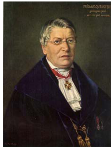
Friedrich August Quenstedt 1809 - 1889

Hörsaal Hölderlinstr. 12 Raum 320, 1.OG 72074 Tübingen