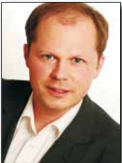
Prof. Dr. Ulrich Trautwein Tübingen

Frühe Bildung im Sinne einer gezielten Förderung schulrelevanter Kompetenzen im Vorschul- und frühen Grundschulalter ist in jüngster Zeit zu einem zentralen Thema der pädagogischen Praxis in Kindergärten und Grundschulen geworden. Nicht selten ist mit der frühen gezielten Förderung schulrelevanter Kompetenzen die Hoffnung verbunden, die große Heterogenität des Leistungsvermögens von jungen Menschen in den deutschsprachigen Bildungssystemen schon früh abbauen zu können, und zwar ohne die Kompetenzentwicklung der Leistungsstarken künstlich zu drosseln. Dies kann man nur erreichen, wenn man weiß, bei welchen Kindern im Vorschulalter Entwicklungsrückstände schulisch relevanter Kompetenzen vorliegen. Dazu bedarf es einer zuverlässigen frühen Diagnose, die eine Prognose der schulisch erfolgreichen Weiterentwicklung erlaubt. Aber ist dies überhaupt leistbar?