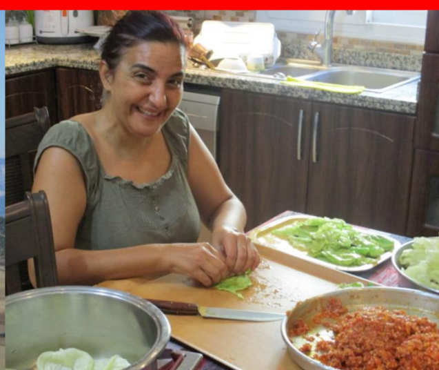
Meine Gastgeberin: eine Frau mit großem Herz und viel Geduld.