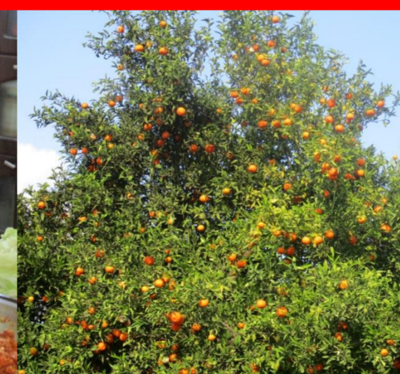
Die Orange: Wahrzeichen der Çukurova.