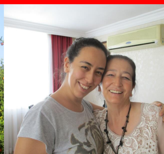
Meine Dolmetscherin und ihre Mutter- erstes Interview.