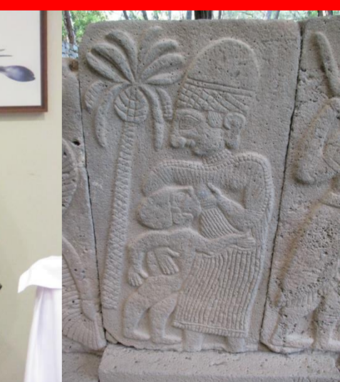
Stillende Hethiterin (Karatepe, ca. 1000 v.Chr.)