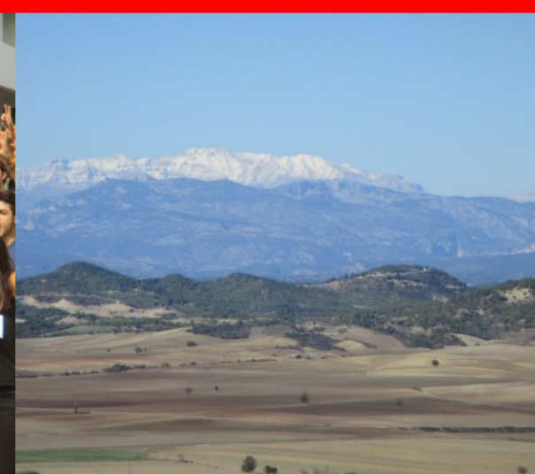
Im Norden von Adana: das Taurusgebirge.