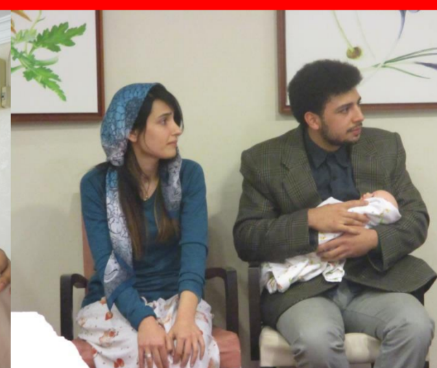
Beim Familienarzt (studentischer Sketch).