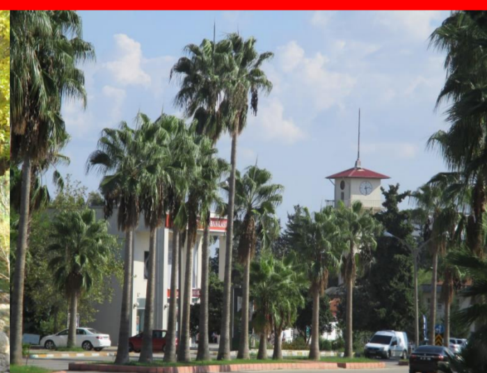
Auf dem Campus.