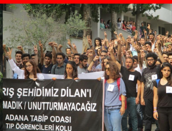
Studentendemonstration für Frieden (13.10.2015)