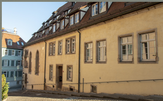
Ansicht des Musikwissenschaftlichen Instituts im Pfleghof