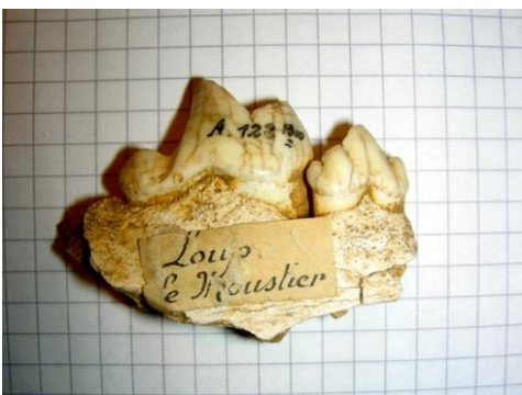
Kieferfragment eines Wolfs aus Le Moustier, das in der neuen Studie untersucht wurde.

Vor kurzem hatte der Wissenschaftler bereits bei Forschungen in einer Höhle im nördlichen Kaukasusgebirge Hinweise gefunden, dass Neandertaler auch Fisch auf dem Speisezettel hatten. „Allgemein werden Neandertalern aufgrund neuerer Studien auch immer qualifiziertere Fähigkeiten zugeschrieben. Der biologische Unterschied zwischen den beiden prähistorischen Menschentypen erscheint immer kleiner“, stellt Bocherens fest. Er geht nicht davon aus, dass kleine Verhaltensunterschiede zwischen den Menschenformen ausreichen, um das Aussterben des Neandertalers und die weltweite Ausbreitung des anatomisch modernen Menschen zu erklären.