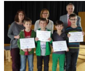
Die erfolgreichen Teilnehmer der HKA Marbach an der 54. Mathematik-Olympiade