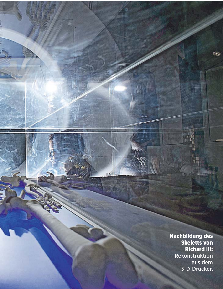
Nachbildung des Skeletts von Richard III: Rekonstruktion aus dem 3-D-Drucker.

kann nach Meinung Rifkins nur in einer Wirtschaft funktionieren, in der die meisten Güter knapp sind. Für eine Welt im Überfluss sei er nicht geeignet. Rifkin schreibt hier seine Vision einer postkapitalistischen Gesellschaft fort, die er schon in seinen vorherigen Büchern (zum Beispiel „Die dritte industrielle Revolution“) entworfen hat.