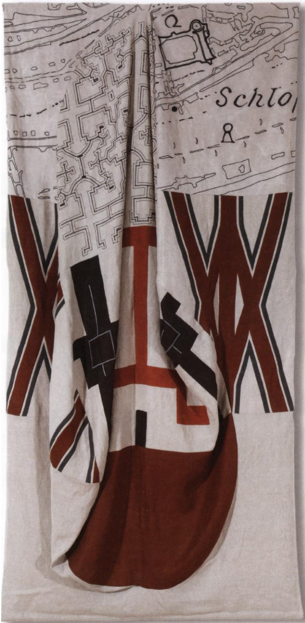
Silke Radenhausen Hybride Topographien, Leinwandobjekt 2000

Bildmaterial erhalten Sie auf Anfrage im MUT