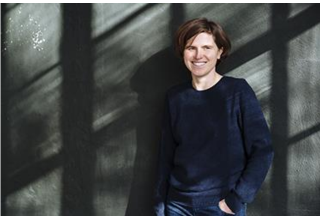
Die deutsche Schriftstellerin Judith Schalansky.

Bitte beachten Sie bei der Verwendung im Internet eine maximale Höhe von 250 Pixel bei 72 dpi. Das Foto bitte nicht archivieren und nicht in sozialen Netzwerken verwenden.