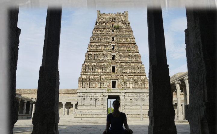
செஞ்சிபுள் வெங்கடராமன் கோயில்