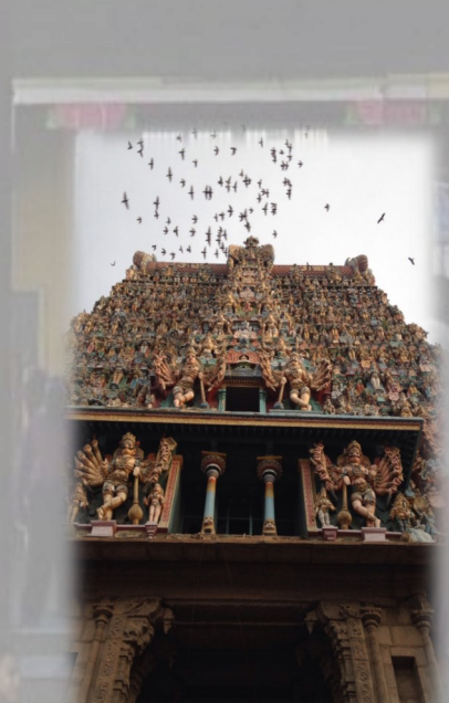
மதுரை மீனாட்சி சுந்தரேசுவரர் கோயில்