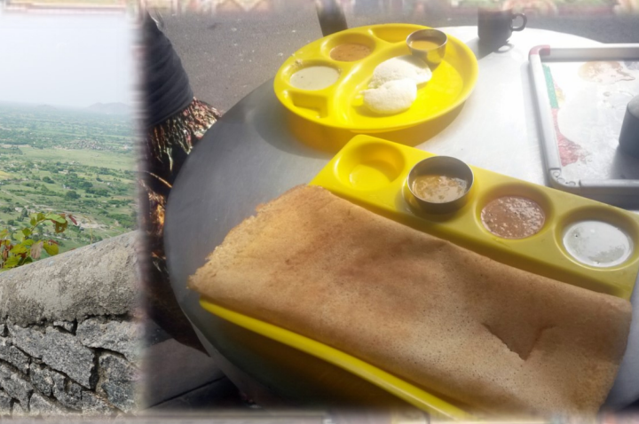
தமிழ் காலத்தோசையும் இடவியும் தேநீரும்