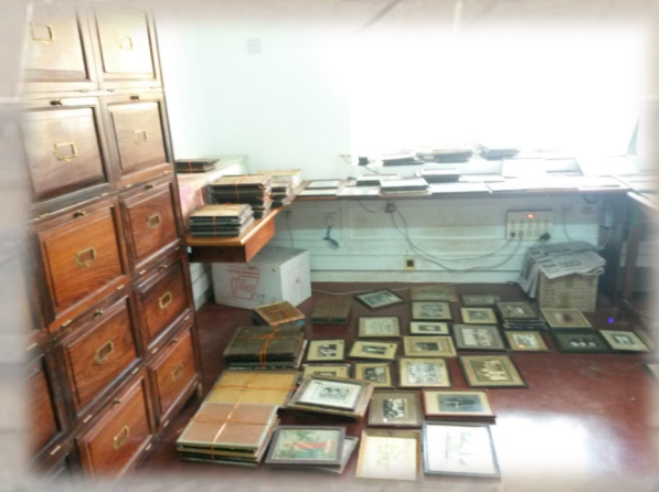
Bildsortierung im IFP

Hilfstätigkeit als Praktikantin bei s/w-Fotografiekollektionsprojekt des Social Science Department: Einsammlung von alten Fotografien in Tamil Nadu, inkl. eventuellen Interviews, Teilnahme an Digitalisierung & Konservierung