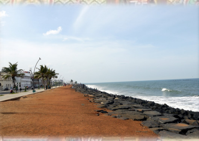
கடற்கரை உலாவும் சாலை