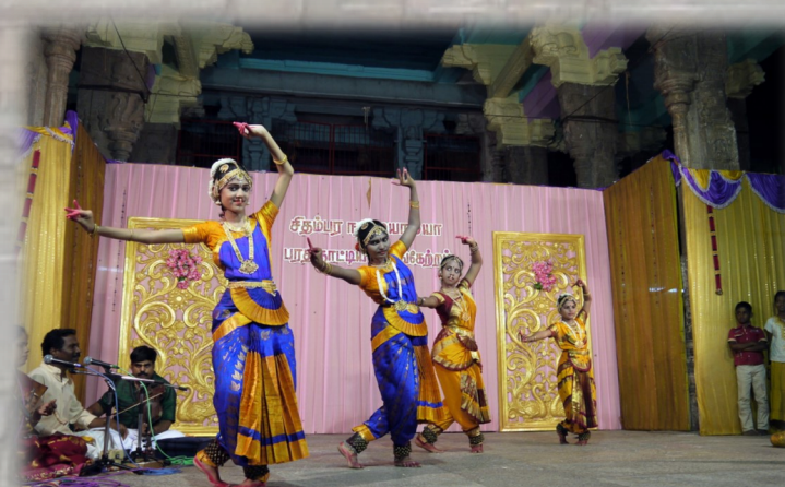
சிதம்பரம் தில்லை நடராஜர் கோயில்