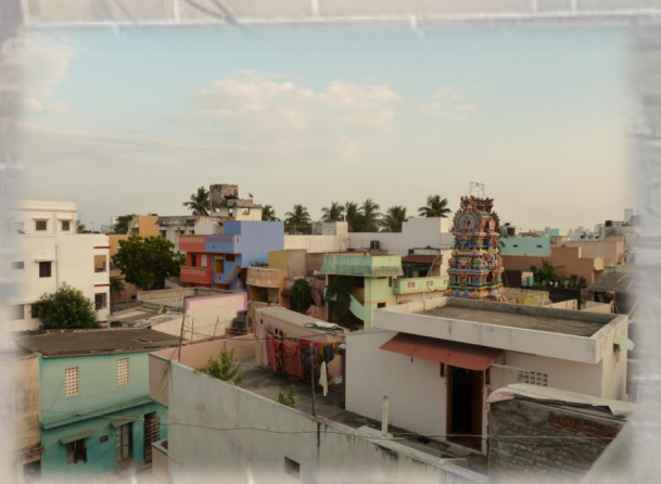
Über den Dächern von Puducherry