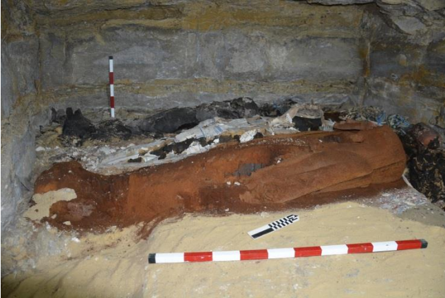
Bildunterschrift: Entdeckung der Sakkara-Maske auf dem Gesicht der Mumie des Zweiten Priesters der Göttin Mut und der Göttin Niut-schi-es.