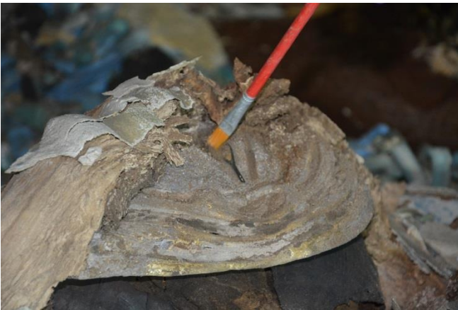
Bildunterschrift: Die Sakkara-Maske wird vorsichtig freigelegt.