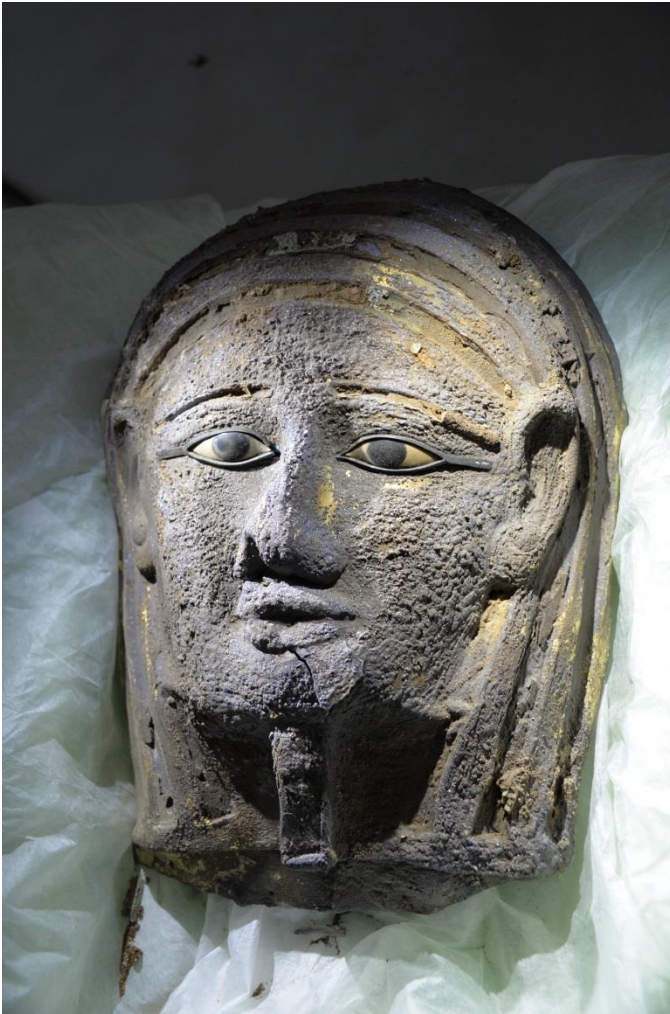
Bildunterschrift: Die Sakkara-Maske des Zweiten Priester der Göttin Mut und der Göttin Niut-schi-es.