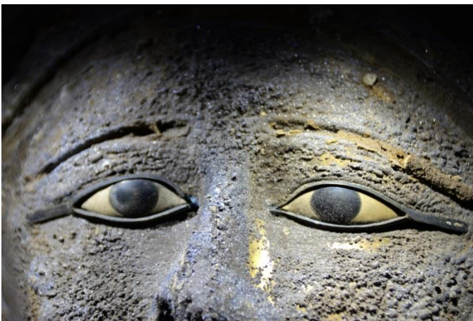
Bildunterschrift: Die Sakkara-Maske des Zweiten Priester der Göttin Mut und der Göttin Niut-schi-es.