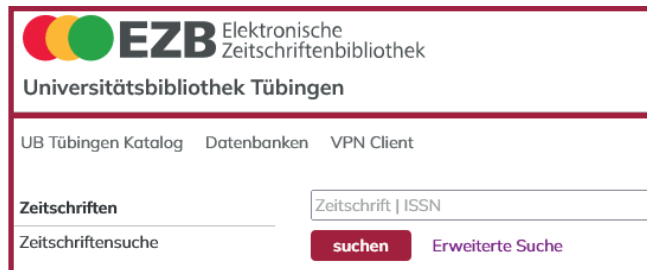
Elektronische Zeitschriftenbibliothek (EZB)

Sind Sie auf der Suche nach spezialisierten Fachdatenbanken, dann hilft Ihnen unser Datenbankinformationssystem (DBIS) weiter. Die lizenzierten Datenbanken sind dort nach Fächern geordnet recherchierbar.