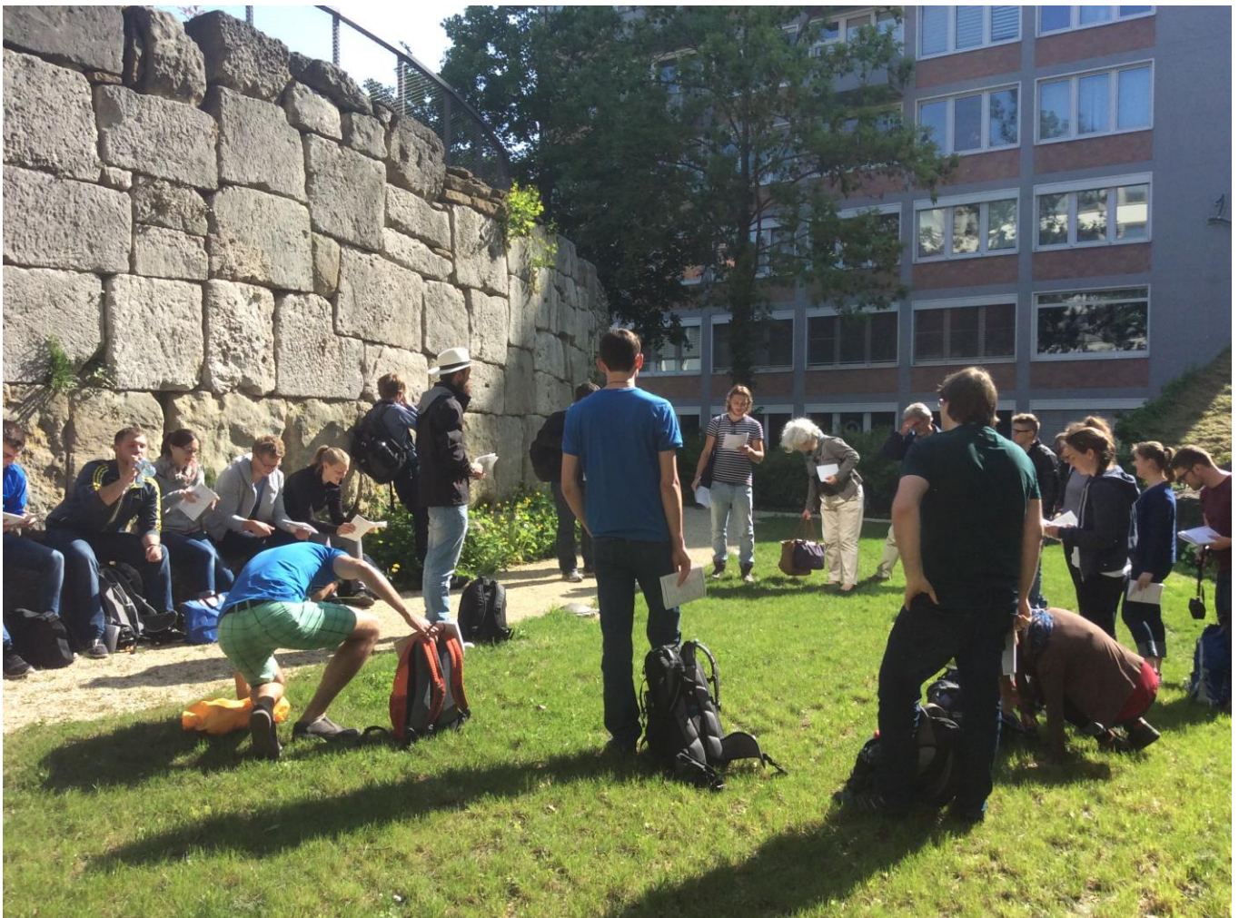
Die Exkursionsgruppe vor den sehr gut erhaltenen Resten der römischen Stadtmauer.