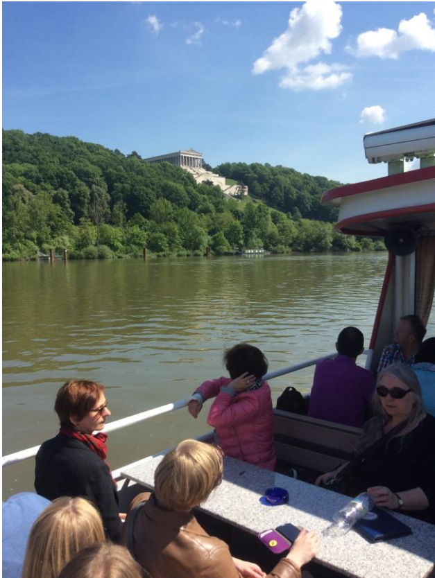
Schifffahrt zur Walhalla

Der nächste Tag begann etwas ruhiger, für einige wegen der längeren Nacht nicht schlecht, mit einer Schifffahrt zur Walhalla.