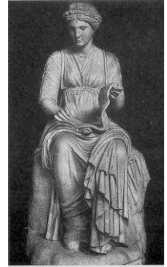
Klio – Muse der Geschichte