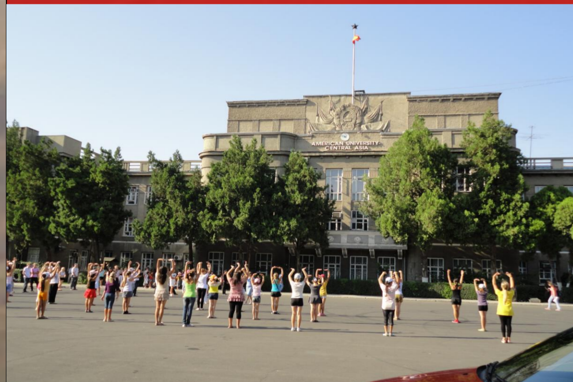
Vorbereitungen für den Tag der Unabhängigkeit am 25. August 2011 vor der AUCA.