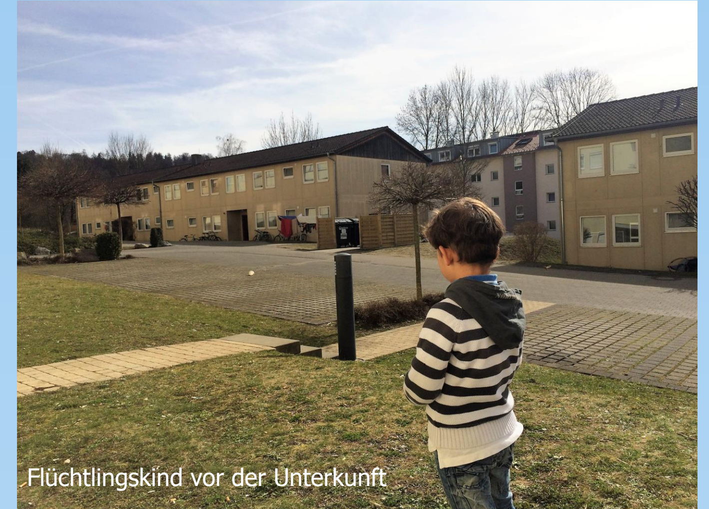
Flüchtlingskind vor der Unterkunft

Zu den Herkunftsländern der Geflüchteten gehörten größtenteils Gambia, Syrien, Albanien, Kosovo, Türkei und Irak. Zu den zentralen Aufgaben zählten Beratung, Betreuung, Hausbesuche und Nachhilfeunterricht. Ich erhielt Schulungen beim Landratsamt Ravensburg für die professionelle Beratung zu rechtlichen Fragen. Die Zusammenarbeit fand mit einem Haupt- und mehreren Ehrenamtlichen statt. Mein Vorgesetzter stand mir bei jeglichen Fragen zur Seite, wodurch es zu einer schnellen Einarbeitung kam. Die Teilnehmende Beobachtung ermöglichte mir einen guten methodischen Zugang.