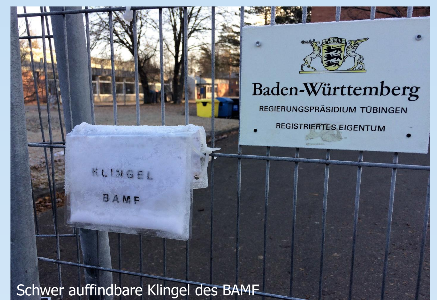
Schwer auffindbare Klingel des BAMF

Die Flüchtlingssozialbetreuung der Unterkunft ist unabdingbar für eine gelingende Integration der Bewohnerinnen und Bewohner. Die Bemühungen sind stets darauf ausgerichtet, die Menschen am Gesellschaftsleben teilhaben zu lassen. Deshalb kümmert sich die Betreuung z. B. um die Vermittlung von Sprachkursen oder ehrenamtlichen Kontakten. Die Betreuung stellt eine Schnittstelle zwischen Geflüchteten und Behörden dar, da eine aktive Mithilfe bei Antragstellungen stattfindet. Durch die Unterstützung bei bürokratischen Angelegenheiten werden administrative Prozesse von Behörden erheblich erleichtert.