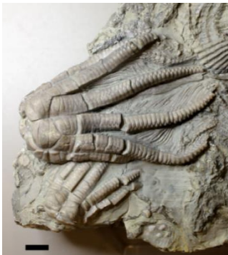
Fossiler Kelch eines Encrinus liliiformis . Maßstab: 1 cm

Hochaufgelöste Fotos wie auch ein Video erhalten Sie unter den folgenden Links der Universität Tübingen. Bitte beachten Sie die Quellenangaben.