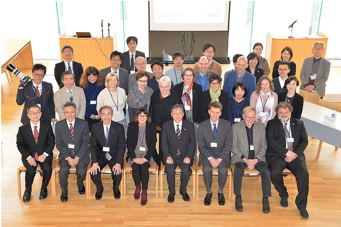
Erster Tag in der Kotobakan Kapelle, Kyōtanabe Campus

Zum Hauptthema: Herausforderungen einer Gesellschaftsstruktur, die „Diversität“ wertschätzt (Challenges toward building societies filled with respect for „Diversity“) wurden Panel Sessions mit folgenden Unterthemen vorbereitet: Diversität bei Menschen mit körperlichen oder seelischen Besonderheiten, Biodiversität, Geschlechterdiversität, religiöse oder ethnische Diversität und Diversität in Begrifflichkeiten und Formulierungen. Über diese Themen erfolgte auf Englisch ein reger Diskussionsaustausch zwischen Forschenden der Dōshisha Universität und der Universität Tübingen.