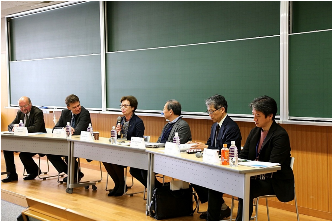
[Panel 3] Ryōshinkan, Raum 305, Imadegawa Campus

Panel 3 konzentrierte sich auf die „Freiheit der Rede/Gedanken und die Rücksichtnahme auf Andere“, was an sich ein rechtswissenschaftliches Thema ist, jedoch weitreichende soziale, politische und kulturelle Auswirkungen hat. Das wurde auch in den fünf Vorträgen klar, die unter anderem das Problem der politischen Rede im Internet hervorhoben, wo Grenzen rechtlicher Restriktionen erklärt wurden, indem sowohl relevante Rechtsurteile als auch die Bedeutung des Bewusstseins kultureller Unterschiede in Bildungsprogrammen angeführt wurden. Die Ergebnisse, die in Bezug auf soziologische und politische Feldforschung präsentiert wurden, gaben einen zusätzlichen und sehr erhellenden Anreiz, die Komplexität des Themas zu verstehen, was mit einem Bericht über eine Bürgerinitiative in Kyoto abgerundet wurde, die sich mit rassistischen Handlungen gegen koreanische Schulen in Japan befasst. (Vorsitzender Hans Peter Marutschke)