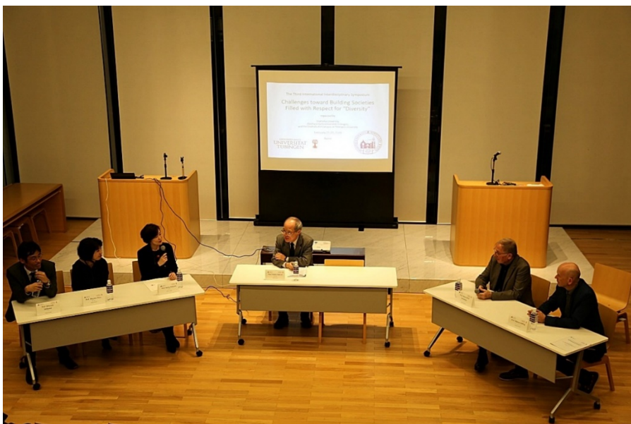
[Panel 1-1] Kotobakan-Kapelle, Kyōtanabe Campus

Nach der Eröffnungszeremonie wurde das Thema „Diversität bei Menschen mit körperlichen oder seelischen Besonderheiten“ aus den neusten naturwissenschaftlichen Forschungen im Hinblick auf die Diversität bei Lebewesen, inklusive dem Menschen, erörtert. Fragen, wie etwa die regenerative Medizin von menschlicher Hornhaut (Cornea), Diversität und Entwicklung von Genmutationen, das Echolot-System bei Fledermäusen und deren technische Anwendung oder auch Probleme der psychischen Verfassung von Kindern und Jugendlichen, wurden in ihrer ganzen Bandbreite besprochen. Hinsichtlich der Auffassung von Diversität bei den experimentellen Wissenschaften in der Medizin, der Biologie, den Ingenieurwissenschaften und der Psychologie gab es tiefgreifende Einsichten sowie einen regen Austausch darüber, welchen Beitrag sie zur Lösung der Probleme in der gegenwärtigen Gesellschaft leisten können. (Vorsitzender Yoshio Sakurai)