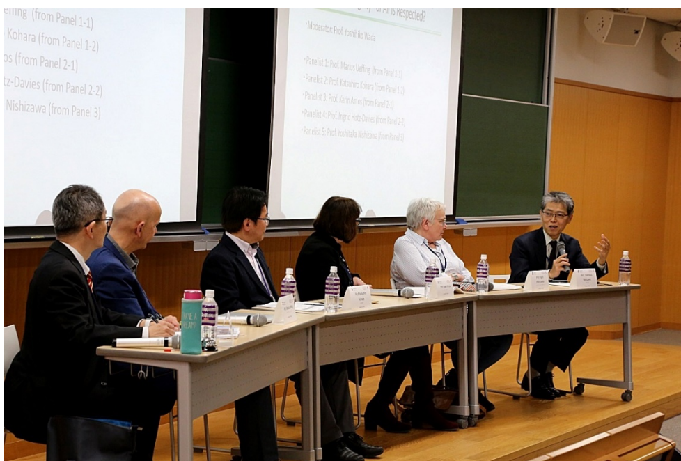
[Runder Tisch] Ryōshinkan, Raum 305, Imadegawa Campus

Beim abschließenden Runden Tisch ging es um die Frage: „Welchen Beitrag können die Universitäten zur Realisierung einer Gesellschaft leisten, in der die „Würde des Menschen“ respektiert wird?“ Dass Diskriminierung und Vorurteile in der Gesellschaft abgebaut werden müssen, um die Würde des Menschen zu bewahren, ist selbstredend, doch es wurde auch bekräftigt, dass die Universitäten auf verschiedenen Ebenen, etwa in Bildungsprogrammen, auf Forscherebene oder im eigenverantwortlichen Wirken der Studierenden einen Beitrag dazu leisten können. Andererseits wurde auch die Meinung vertreten, dass die Universitäten sich darauf konzentrieren sollten, der Wahrheitsfindung dienende methodische Grundlagen zu unterrichten. So könnte das Aneignen einer dem eigenen Kopf entspringenden Urteilsfähigkeit schneller zur Problemlösung führen. Das Ergebnis dieser Diskussion war die Erkenntnis, dass beides, sowohl der Erwerb eines kritischen Geistes, als auch eine Empathie und Ethik vermittelnde „Moralerziehung“ von Bedeutung sind. Eine der geistigen Stützen bei der Gründung der Dōshisha Universität, nämlich das notwendige „Schritt-Halten von Geist und Moral 知（智）徳併行“ ist somit zu einem Gemeingut beider Universitäten geworden. (Moderator Yoshihiko Wada)