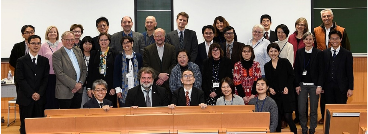
Nach Beendigung aller Sektionen im Ryōshinkan