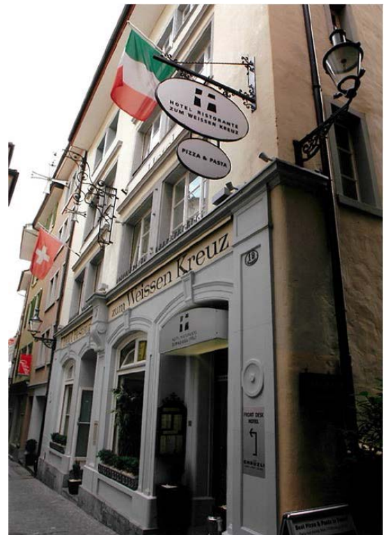
Das ‚Hotel zum Weissen Kreuz‘ in Luzern, in dem Neesima am 8. August 1884 abstieg, existiert heute noch. Zwei Wochen nach seinem Aufenthalt hier kam es zum Treffen mit Hermann Hesse