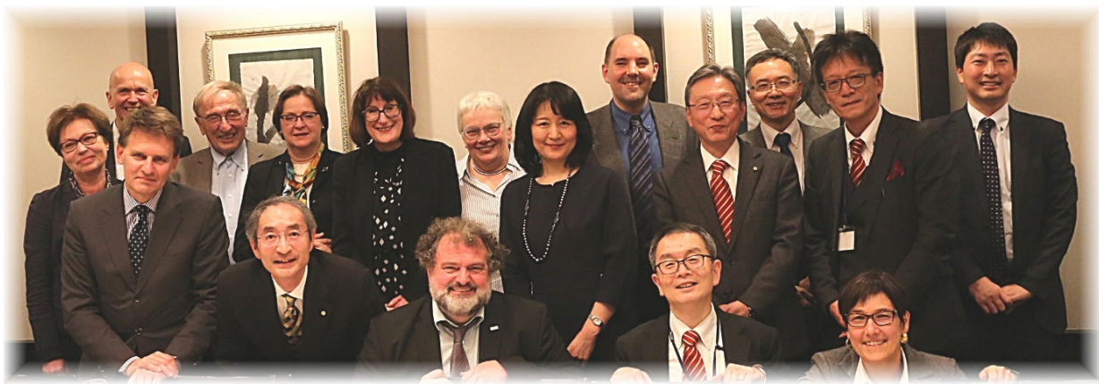
Die Delegation aus Tübingen mit Präsident Matsuoka, Vizepräsidentin Ueki und Vizepräsident Yokogawa beim offenen Gespräch