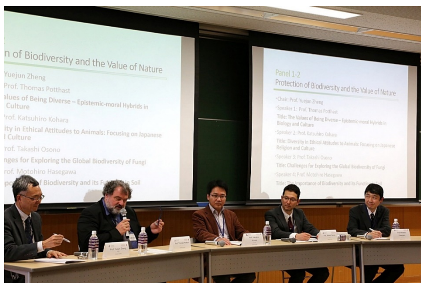
[Panel 1-2] Ryōshinkan, Raum 305, Imadegawa Campus

Im Rahmen von Panel 1-2 wurden Debatten zu den Schlüsselbegriffen von Biodiversität und dem Wert von Natur geführt. Vier Redner aus dem In- und Ausland präsentierten ihre neuesten Forschungen zu Ausprägung und Bedeutung von Diversität, und zwar jeweils aus ethischer und kognitiver Perspektive: im Bereich der Biodiversität und kultureller Diversität, der Geschichte über die Beziehung von Mensch und Tier, der Vielfalt von Pilzen weltweit und schließlich der Biodiversität im Boden. Danach entwickelte sich unter Einbezug des gesamten Plenums ein tiefgreifender interdisziplinärer Diskurs. Durch einen regen Meinungs austausch kam man übereinstimmend zu der Erkenntnis, dass bezüglich der Biodiversität bis heute noch viele Fragen offen sind und dass es wichtig ist, das Bewusstsein der Allgemeinheit gegenüber der Bedeutung von Biodiversität zu stärken. Hier wurde auch auf die Dringlichkeit verwiesen, Forschungen durchzuführen, die einen Beitrag zur Planung politischer Maßnahmen liefern. (Vorsitzender Yuejun Zheng).