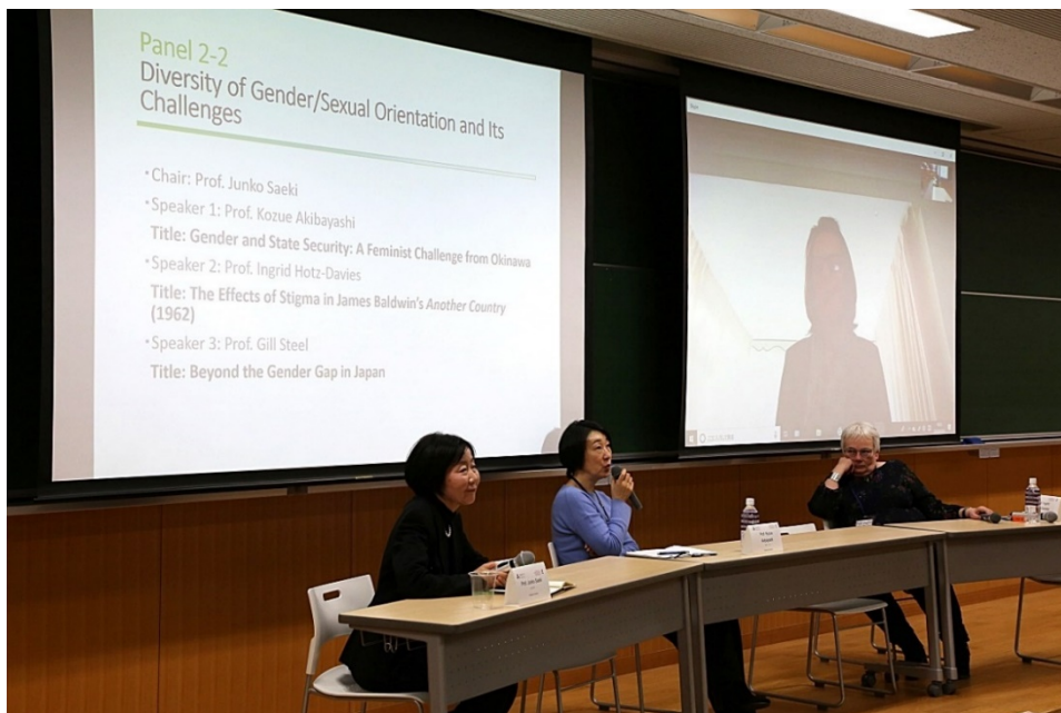
[Panel 2-2] Ryōshinkan, Raum 305, Imadegawa Campus