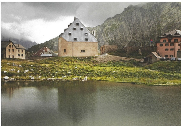
Das Hotel auf dem St. Gotthard Pass, in dem Neesima sein Testament verfasst haben soll

Die erste Anekdote handelt vom Zusammentreffen des Gründers der Dōshisha Universität mit Hermann Hesse. Neesima reiste während seiner zweiten Europareise am 5. August 1884 von Italien aus in die Schweiz ein. Tags darauf kollabierte er aufgrund eines Herzanfalls auf dem Gotthard Pass, und schrieb infolgedessen sein Testament. Zwei Tage nach dem Zusammenbruch und nachdem sich sein Zustand etwas verbessert hatte, stieg Neesima den Pass hinab und setzte seine Reise mit Eisenbahn und Schiff nach Luzern fort, das mitten in der Schweiz gelegenen ist.