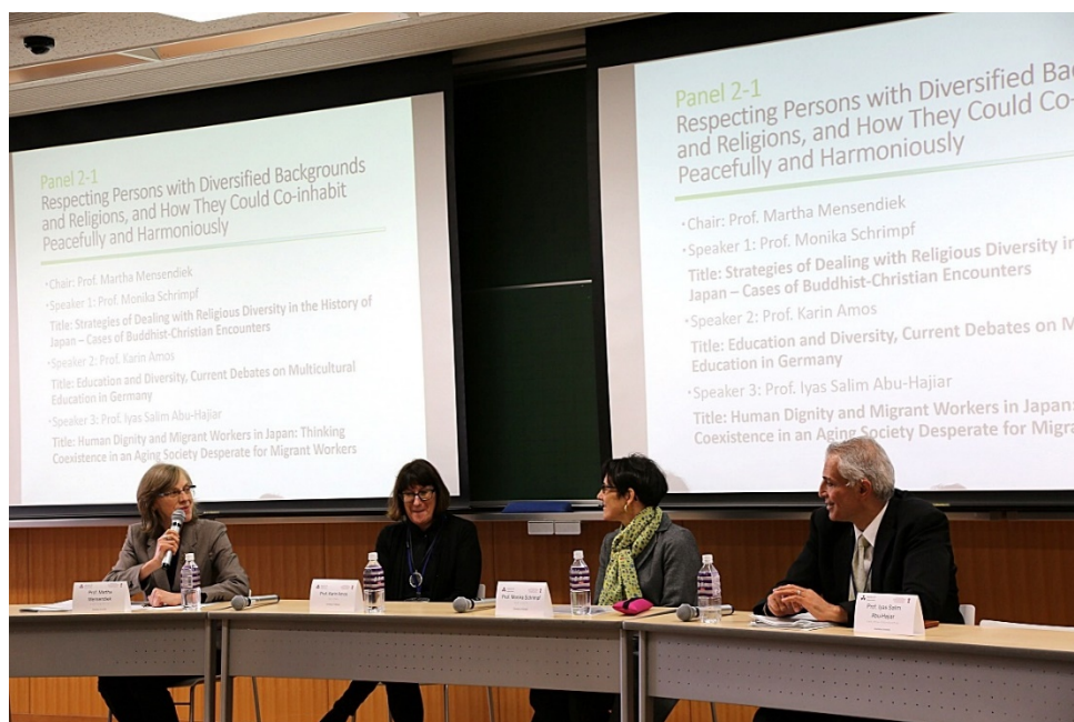
[Panel 2-1] Ryōshinkan, Raum 305, Imadegawa Campus

Das Panel zum Thema „Respekt und Koexistenz von Menschen unterschiedlicher Ethnie und unterschiedlichem religiösem Hintergrund“ bot eine wertvolle Möglichkeit, aus der Betrachtung des interreligiösen Austausches in der Geschichte Japans, der multikulturellen Bildung in Deutschland und schließlich der Maßnahmen hinsichtlich ausländischer Arbeitskräfte in Japan, die soziale Diversität und Koexistenz zu reflektieren. Allgemein konnte bestätigt werden, dass die von den jeweiligen Spezialgebieten abweichende „dualistisch“ ausgerichtete Denkweise Ausgrenzung, Intoleranz und Konfrontation zur Folge hat. Des Weiteren wurde die Erkenntnis geteilt, dass in Diversität auch Gemeinsamkeiten auszumachen sind, und dass ein Miteinander immer auch die Wertschätzung der Menschenwürde voraussetzt. Außerdem gab es viele Anregungen und Vorschläge zur Frage, wie Erziehung ein Verständnis von Diversität vermitteln kann. (Vorsitzende Martha Mensendiek)