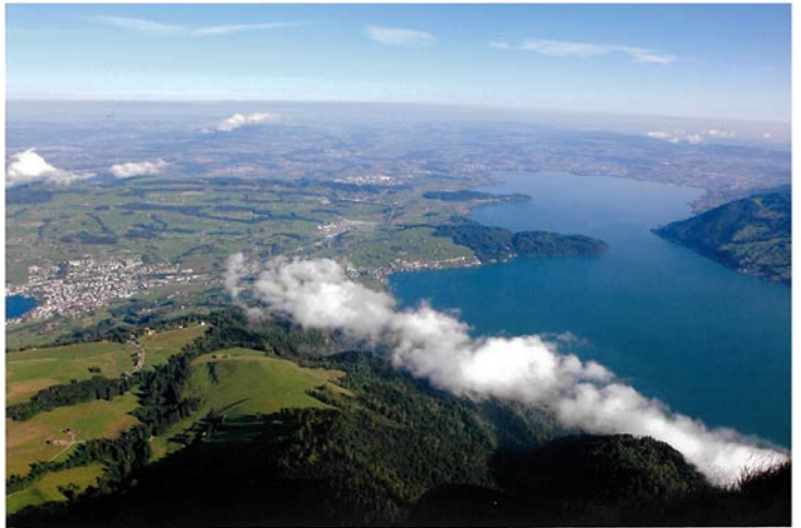
Die Bergbahn in den Rigi Bergen und die Aussicht von Rigi Kulm

Hermann Hesse verbrachte einen Teil seiner Jugend in Tübingen, wo er in der Nähe der Universität eine Lehre in der Buchhandlung Heckenhauer absolvierte und danach zu einem Schriftsteller avancierte, der repräsentativ für Deutschland steht (1946 erhielt er den Literaturnobelpreis). Heute ist ein Teil der Buchhandlung, in der Hesse gearbeitet hatte, zu einem kleinen Museum, dem Hesse Kabinett, umgestaltet. Auf einem Gelände nicht weit von diesem Hesse Kabinett entfernt, konnte durch die Unterstützung der Universität Tübingen der EU-Campus errichtet werden. Von dieser Buchhandlung, die mit Hesse in Verbindung steht, ist der EU-Campus, der mit Neesima in Beziehung steht, gut zu Fuß erreichbar. Die Gründung erfolgte 133 Jahre nach der Begegnung dieser beiden Menschen und ruft das Gefühl einer wundersamen Verbundenheit hervor.