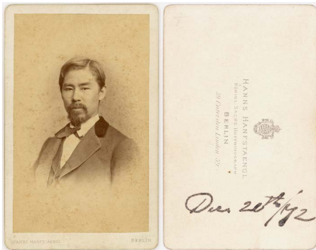
Portraitfoto von Neesima, das in Deutschland aufgenommen wurde (Fotostudio Berlin, 1872)