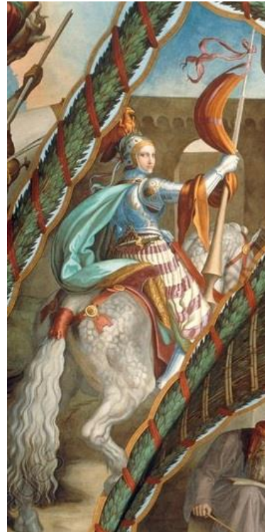
Julius Schnorr von Carolsfeld: Deckenfresko im Casino Massimo, Rom (Detail).