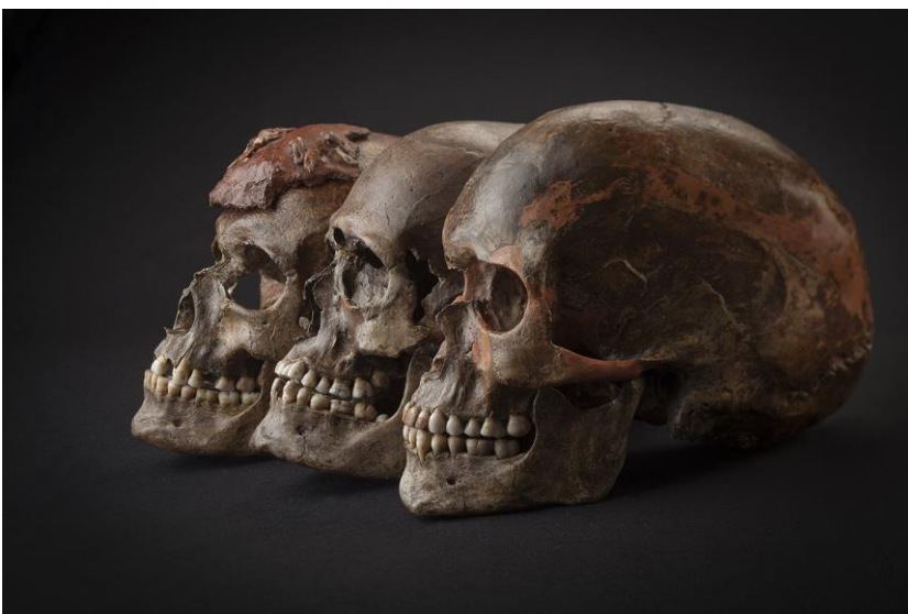
Drei rund 31.000 Jahre alte Schädel aus Dolni Věstonice in der Tschechischen Republik. Alle in der Studie untersuchten Menschen, die in den darauf folgenden 5.000 Jahren lebten – sei es im heutigen Belgien, der Tschechischen Republik, Österreich oder Italien – waren eng verwandt. Dies deutet auf eine Ausbreitung der Menschen hin, die mit der archäologischen Kultur des Gravettien verbunden war.

Weiterhin ergaben die Analysen, dass die frühesten modernen Menschen in Europa nicht substantiell zur Genausstattung heutiger Europäer beitrugen. Wie bereits eine frühere Studie anhand der Mitochondrien-DNA gezeigt hatte, stammen alle Individuen, die zwischen 37.000 und 14.000 Jahren alt sind, von einer einzelnen Gründerpopulation ab, die auch die Vorfahren heutiger Europäer bilden. „Wir sehen aber auch eine Kontinuität zwischen den ersten modernen Menschen Europas, die vor 40.000 bis 32.000 Jahren die wunderbare Kunst der Schwäbischen Alb geschaffen haben, und den Bewohnern West- und Zentraleuropas nach der Eiszeit, vor 18.000 bis 14.500 Jahren“, erklärt Krause. Zwischendurch habe sich eine Population hineingemischt, bekannt als Mammutjäger Osteuropas, die aber durch die Eiszeit vor 23.000 bis 19.000 Jahren zurückgedrängt worden sei. Das komplexe Bild der Genetik europäischer Menschen wollen die Forscher im nächsten Schritt mit ähnlichen Genomanalysen von urgeschichtlichen Menschen aus Südosteuropa und dem Nahen Osten weiter vervollständigen.