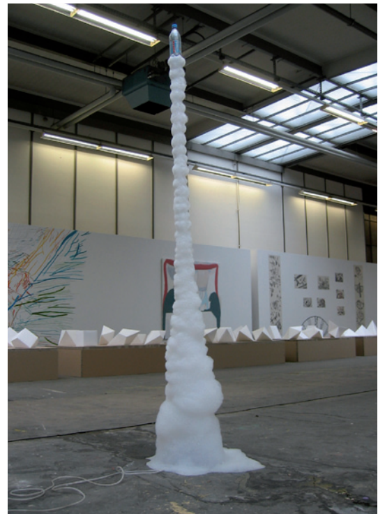
// Abbildung 05

— Stofflichkeit wird von Hamann dann folgendermaßen charakterisiert: Das Stoffliche zeichne sich durch Nachgiebigkeit, Formlosigkeit, Veränderlichkeit und Weichheit aus, es sei dem Wesen nach ohne feste Konturen. Ein signifikantes Merkmal bestehe in seiner Tendenz zum Zerrinnen und Insichzusammensinken. Hinzukomme noch das Molekulare des Stofflichen, d.h. dessen „Geteiltheit, Undichte, Durchlässigkeit und damit Auflösbarkeit in viele Teile“ sowie die „Verschiebbarkeit [dieser] Teile bei