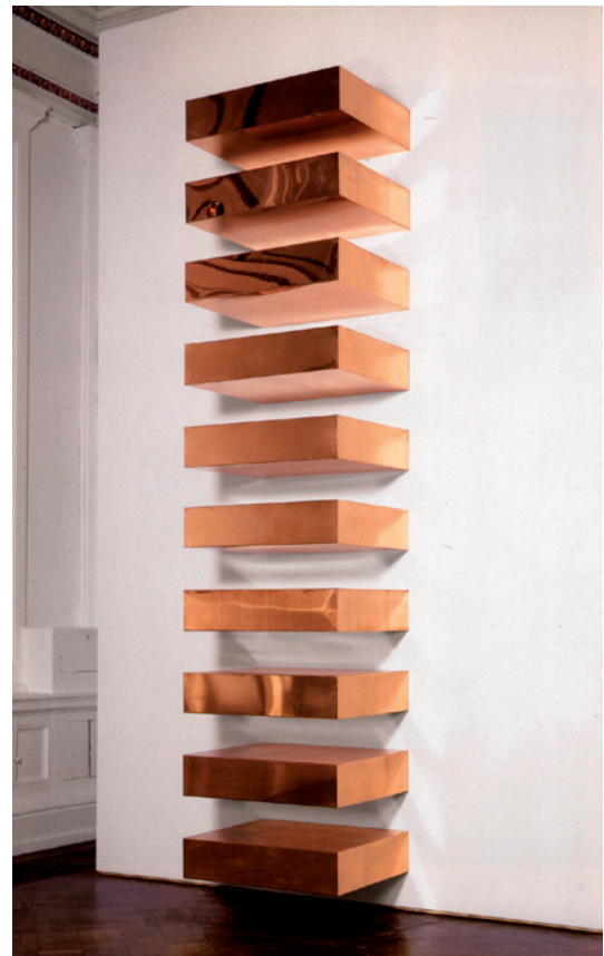
// Abbildung 02 Donald Judd, Ohne Titel (DSS 204) , 1969, 10 Elemente, je 23 x 101,6 x 78,7 cm, Solomon R. Guggenheim Museum, New York.

2) Duchamps Fountain (1917) kann als Urahn der von Biehler verwendeten Sanitärkeramiken gelten. Doch anders als im Fall des zweckentfremdeten Urinals wurde in Venus World auf eine „radikale Singularisierung“ (Egenhofer 2008: 135) des eigentlich nur im anonymen Kollektiv existierenden Massenprodukts verzichtet. Durch die fünffache Wiederkehr des baugleichen Waschbeckens bleibt dessen Warenförmigkeit deutlich im Bewusstsein. Eine Art überschäumende Replik auf Duchamps Pissoir präsentierte Biehler in ihrer Aktion Luftschlösser (1996), in der aus einem WC-Becken eine Seifenschaummasse wuchs.