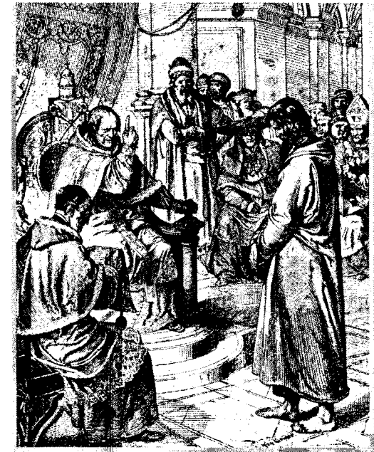
P.J.N. Geiger, Canossa (um 1840)