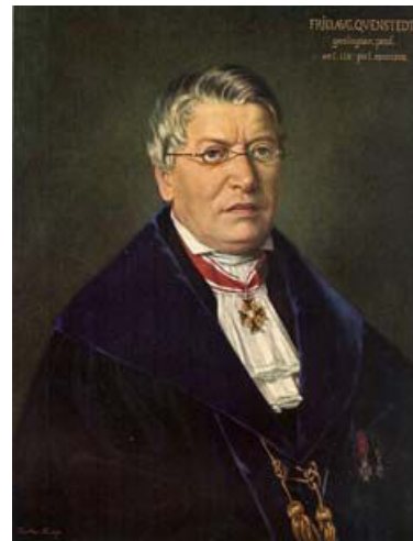
Friedrich August Quenstedt 1809 - 1889

Spenden bitte mit vollständiger Anschrift, damit die (steuerabzugsfähige) Spendenbescheinigung zugesandt werden kann.