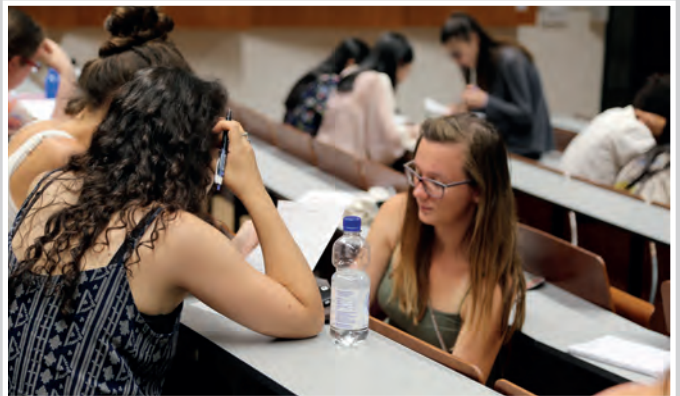
Teilnehmerinnen und Teilnehmer der International Education Week