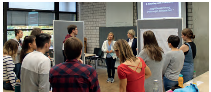
Workshop Lehr:werkstatt: Studierende im Kompetenzworkshop „Team Teaching“ im Oktober 2019