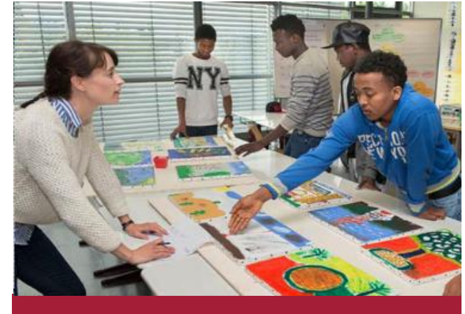
Philosophische Fakultät Asien-Orient-Institut/ Abteilung Ethnologie