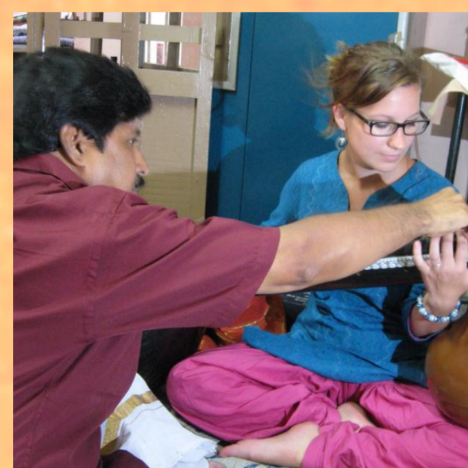
Beim Veena spielen