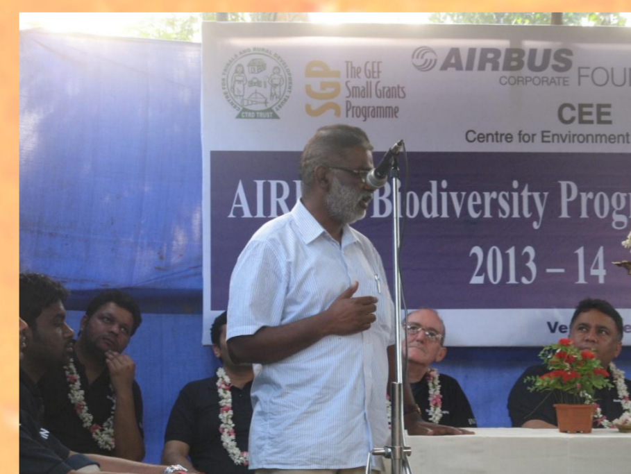
Mr. RS. Ranganathan