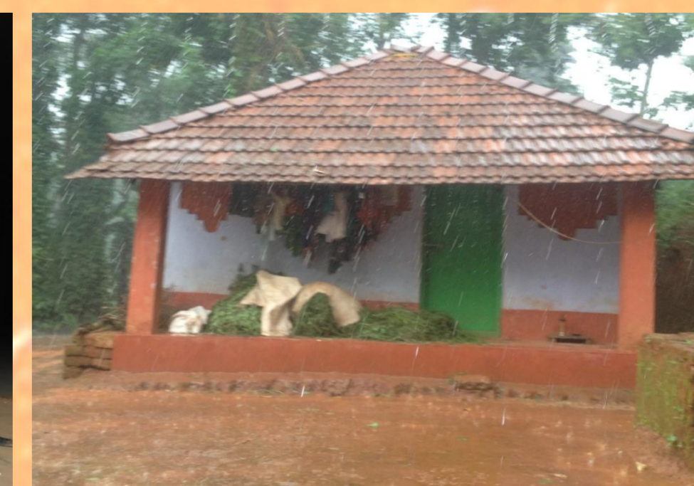
Ein vom CTRD erbautes Haus