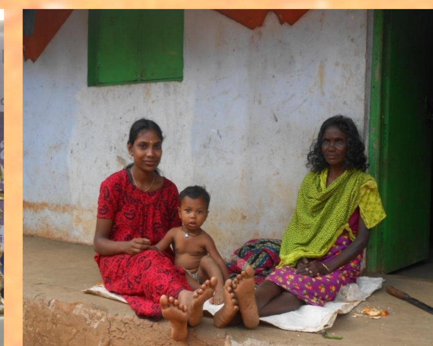
Bewohner eines Paniya-Dorfes