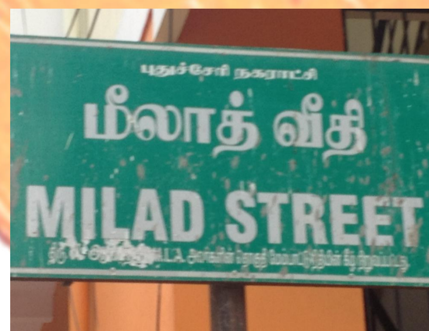
Meine Adresse in Pondicherry

Durch mein Nebenfach Rechtswissenschaften und dem damit verbundenen Interesse an der Rechtsethnologie beschloss ich, meine BA-Arbeit über dieses Thema zu verfassen.