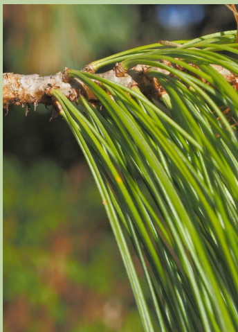
Die Nadeln sitzen zu fünft am Kurztrieb.

Ihr wissenschaftlicher Name geht auf Nathaniel Wallich zurück. Er war Arzt und Botaniker aus Kopenhagen, der lange in Indien lebte und für die britische East India Company arbeitete. Während seiner Schaffenszeit und zahlreicher Reisen in Asien legte er ein Herbarium mit mehr als 20 000 Belegen an, das heute im Royal Botanical Garden in Kew, London aufbewahrt wird. Darunter sind auch einige Belege der Tränen-Kiefer, die Wallich beispielsweise in Nepal selbst gesammelt hat. Damals gab er dieser Kiefer den Namen „ Pinus excelsa “. Knapp hundert Jahre nach seinem Tod wurde die Tränen-Kiefer neu beschrieben und nach ihm „ Pinus wallichiana “ benannt. 1823 wurde die Tränen-Kiefer in Europa eingeführt.