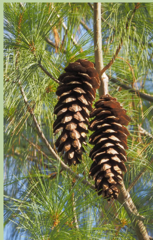
Die Zapfen können 30 cm lang werden.