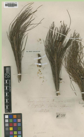
Beleg aus Nepal, 1786, gesammelt von N. Wallich.