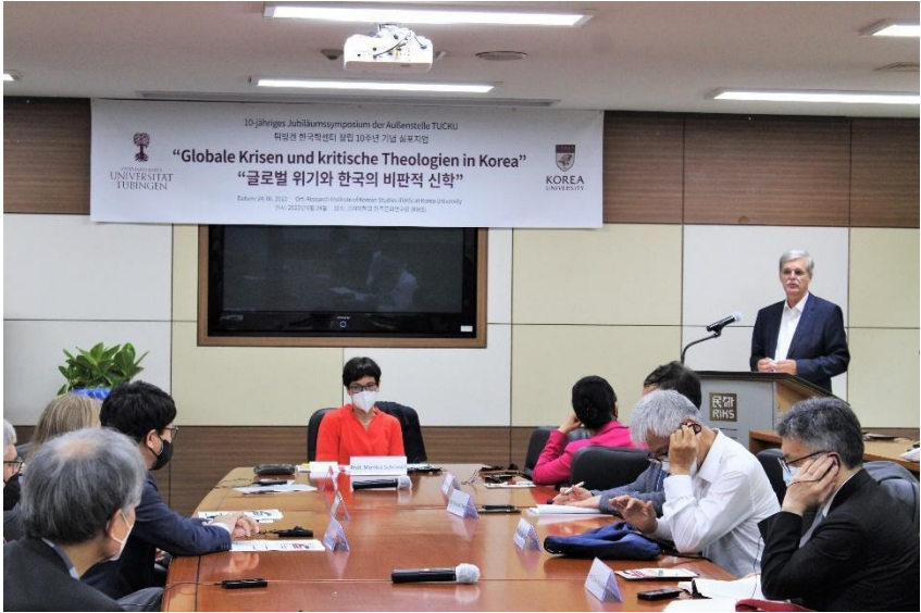
Jubiläumssymposium am 24.06.2022 in Korea University