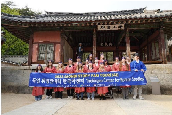
Exkursion nach Andong im Mai 2023

Andong ist eine Stadt, die mitten in der Natur relativ östlich in Korea gelegen ist. Da der Konfuzianismus hier besonders stark ausgeprägt war und teilweise auch noch ist, kann man wichtige Teile der koreanischen Kultur aus der Nähe erleben. Ein Beispiel dafür sind der Besuch bei einem Stammesältesten eines Familienklans oder das Hauskonzert mit traditionellen koreanischen Instrumenten. Außerdem kann man bei einem Besuch im Erlebnisdorf für koreanische Kultur selbst koreanische Kinderspiele ausprobieren und einen Fächer selbst bemalen. Durch die wunderschöne Landschaft kann man sich aber auch etwas vom Trubel in Seoul erholen und einen Spaziergang am See machen. Andong ist definitiv eine Reise wert!