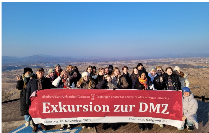
DMZ in Cholwon in 2023

Auf dieser Exkursion werden nicht nur die DMZ (demilitarisierte Zone), sondern auch Sehenswürdigkeiten von Cholwon besichtigt und regionale Speisen probiert. Es wird auch an einem abendlichen Talk Concert über die Teilung und Wiedervereinigung in Deutschland und Korea teilgenommen, in dem auch zwei Tübinger Studierende aus Ost- und Westdeutschland mitdiskutieren können.