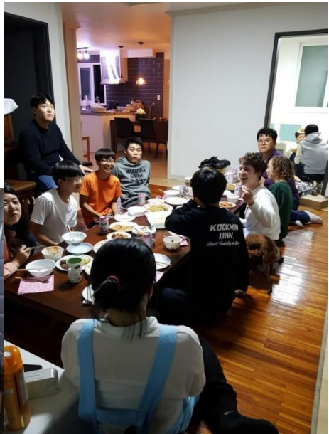
Group home aus Nordkorea geflüchteter Jugendlicher (2017)