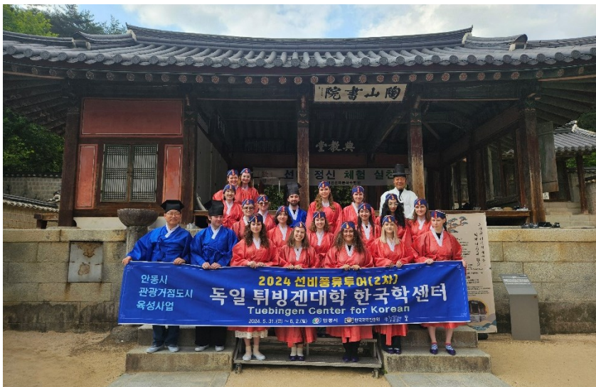
Andong im Juni 2024

Während der ersten und zweiten Woche ist aufgrund der „add & drop“-Phase etwas Spielraum für Ummeldungen vorhanden. Aufgrund der intensiven und zeitaufwändigen Sprachkurse wird nicht empfohlen, mehr als einen inhaltlichen Kurs pro Semester zu belegen. Bei konkreten Fragen zum Kursangebot und zur Seminaranmeldung wenden Sie sich bitte an das jeweilige International Office der Universität.