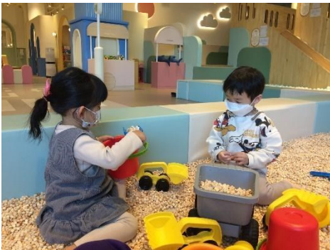
Crevill Kinder Café Einrichtung 2021

Crevill ist eine Kette von Kinder Cafés ( https://crevill.com ), wobei man einen Praktikumsplatz bzw. Nebenjob als Englisch Lehrerin für Kinder zwischen 4-10 Jahren absolvieren kann. Hierbei sind Kreativität, Belastbarkeit und Flexibilität der Studierenden gefragt, wenn es zur Unterrichtsgestaltung der Kinder kommt. Ebenso gehören zum Aufgabenbereich die Beaufsichtigung der freien Spielzeit, die Umdekorierung der Einrichtung sowie das Aufräumen! Wer sich gern mit Kindern umgibt, verantwortungsvoll ist und kreativen Englischunterricht gestalten möchte, dem kann dieses Praktikum nur empfohlen werden!