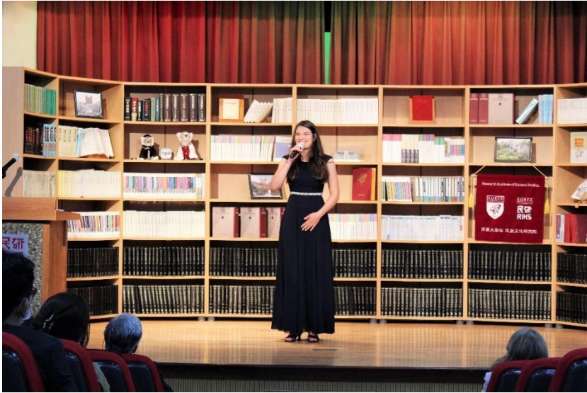
10-jähriges Jubiläum am 24.06.2022 in Korea University