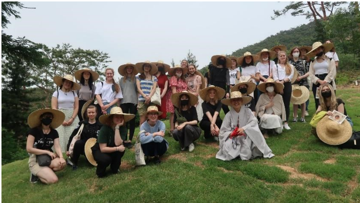
Templestay in Jingwansa am 04.06.2022