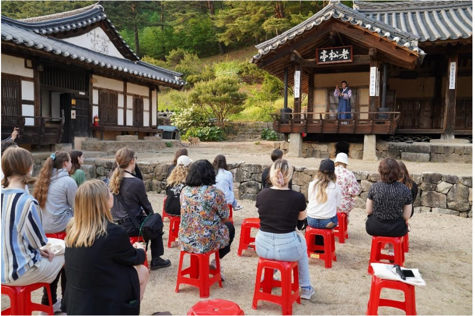
Konzert im Stammhaus in Andong im Mai 2023